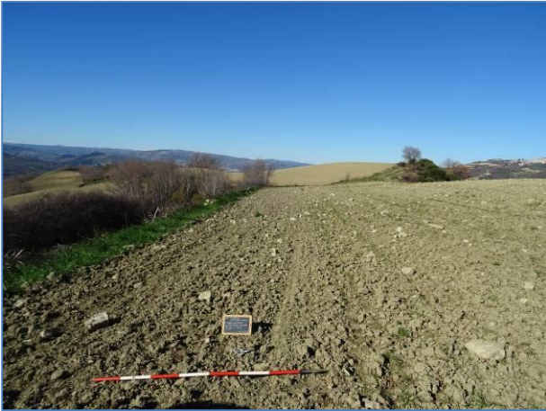
Fig. 3. Vista del settore NO dell'UT 1, da E.