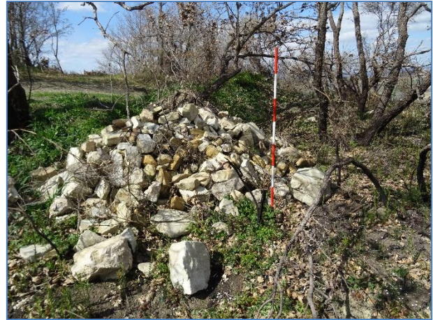
Fig. 12. L'accumulo di pietrame e materiali nell'area Boschiva

A seguito dello studio bibliografico e archivistico e delle indagini di superficie svolte, in accordo con le Soprintendenze ABAP competenti, i saggi di indagine preliminare proposti risultano così distinti: