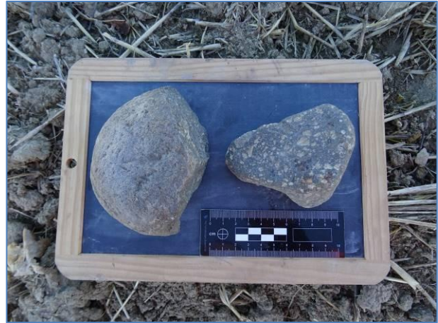
Fig. 5. Vista del settore centrale dell'UT 2, da NO. Fig. 6. Frammenti di macine a sezione piano - convessa.

L'UT 3 è stata individuata nel territorio comunale di San Marco La Catola (FG), in loc. Salita del Signore, in un campo arato, su un terreno in leggera ma graduale pendenza da SE verso NO, che si affaccia verso N in direzione del Torrente La Catola e verso O/SO in direzione del Fiume Fortore. L'UT presenta dimensioni massime pari a m 70 x 33; non si rileva un nucleo di dispersione, ma una concentrazione di materiale delimitata da terreni con visibilità nulla o aree boschive.