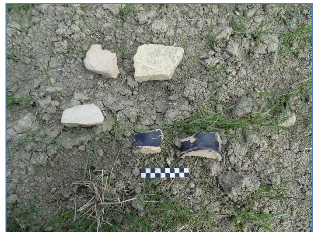
Fig. 10. Alcuni dei materiali dell'UT 4.

L'UT 5 è stata individuata nel territorio comunale di San Marco La Catola (FG), in loc. Monte Calvo, in un campo coltivato a seminativo con pendenza da S/SE verso O/NO. L'UT presenta dimensioni massime visibili pari a m 30 x 20 in senso SE – NO ed è delimitata sui lati S, E ed O da un'area boschiva non percorribile. La distribuzione del materiale è di circa 5-8 frammenti / mq; la concentrazione è costituita da frammenti di laterizi in dimensioni piccole e medio – piccole, associati a scarse pietre, a frammenti di basalto riferibili a macine ed a scarsi frammenti ceramici, costituiti pressoché esclusivamente da dolia. Numerosi materiali sono stati rinvenuti all'interno di un cumulo di pietre posto all'interno dell'area boschiva, costituito pressoché esclusivamente da frammenti di dolia (sia pareti che orli che fondi) che frammenti di tegole, con esemplari di dimensioni maggiori rispetto a quelli visibili sul terreno. Il materiale nel suo complesso è scarso e non vi sono materiali diagnostici; gli impasti dei dolia sembrano poter essere riferibili ad una fattoria di epoca ellenistica.