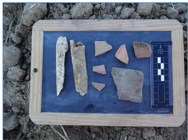
Fig. 7. Vista del settore centro - N dell'UT 3, da S. Fig. 8. Alcuni dei materiali che costituiscono l'UT 3.