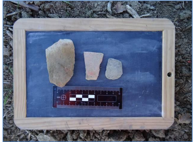
Fig. 4. I materiali ceramici dell'UT 1.

L'UT 2 è stata individuata nel territorio comunale di San Marco La Catola (FG), in loc. Salita del Signore, in un campo arato, su un terrazzo collinare con orientamento SE – NO, che si affaccia verso N in direzione del Torrente La Catola e verso O/SO in direzione del Fiume Fortore, a breve distanza a NO della UT 1.