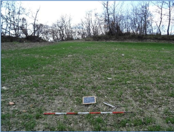
Fig. 11. Vista dell'UT 5, da NO.