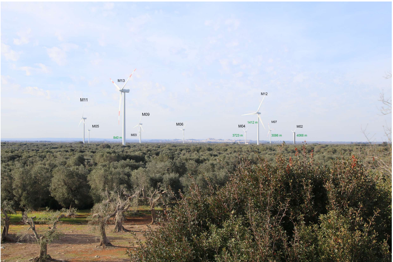
Figura 2: Impianto Eolico in territorio di Erchie (Brindisi). Aerogeneratori Gamesa G90 - Altezza al rotore m. 80, tip m. 120 Società Eolica Erchie (Realizzato). Punto di Ripresa 40.408737 17.725408 (SS 7TER) verso il baricentro impianto. Si noti come aerogeneratori con altezza pari a metà di quella di progetto sono visibili a distanza di 4000 metri.