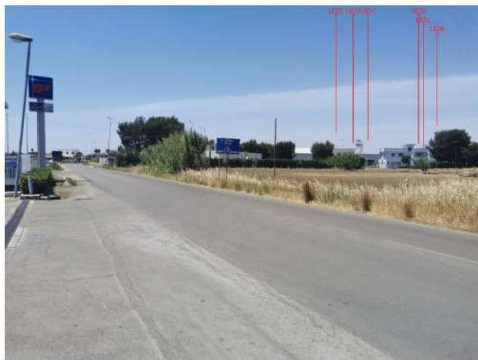
Scatto P03 Post operam