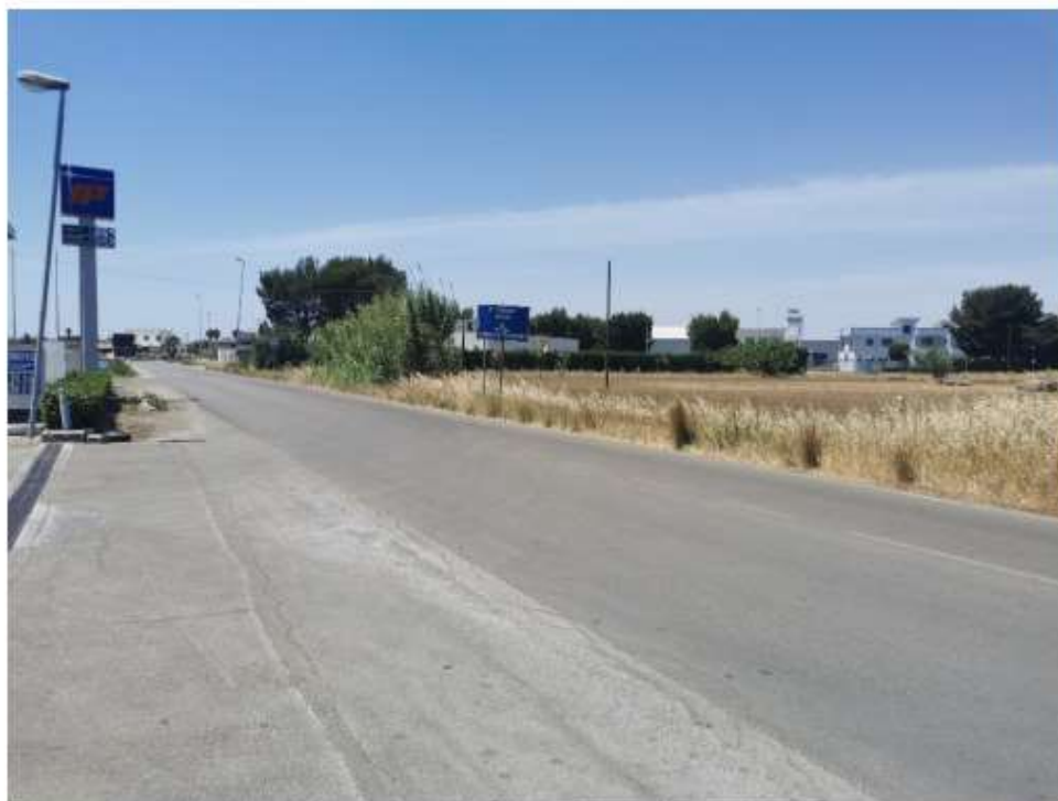
Scatto P03 Ante operam

WTGs VE02 e LE03, LE04, LE05 e LE06, in quanto vi è una morfologia pianeggiante, ma di fatto non del tutto percepibili data la presenza di ostacoli visivi.