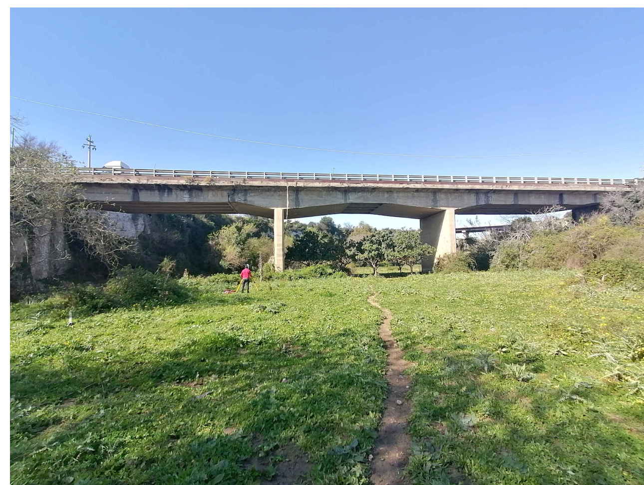
OPERA 26 VALLE