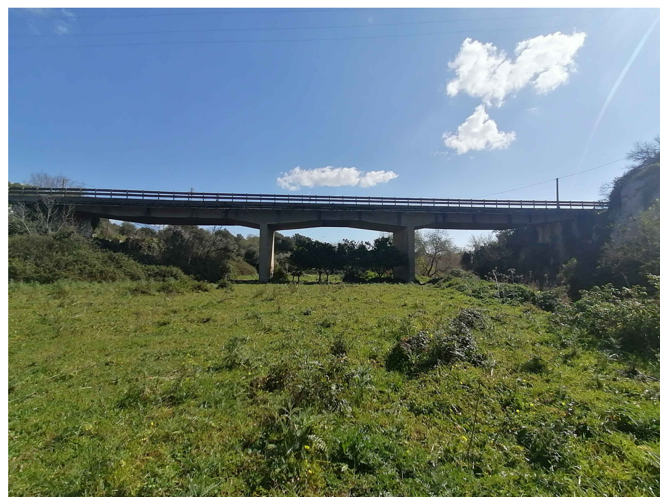
OPERA 26 MONTE