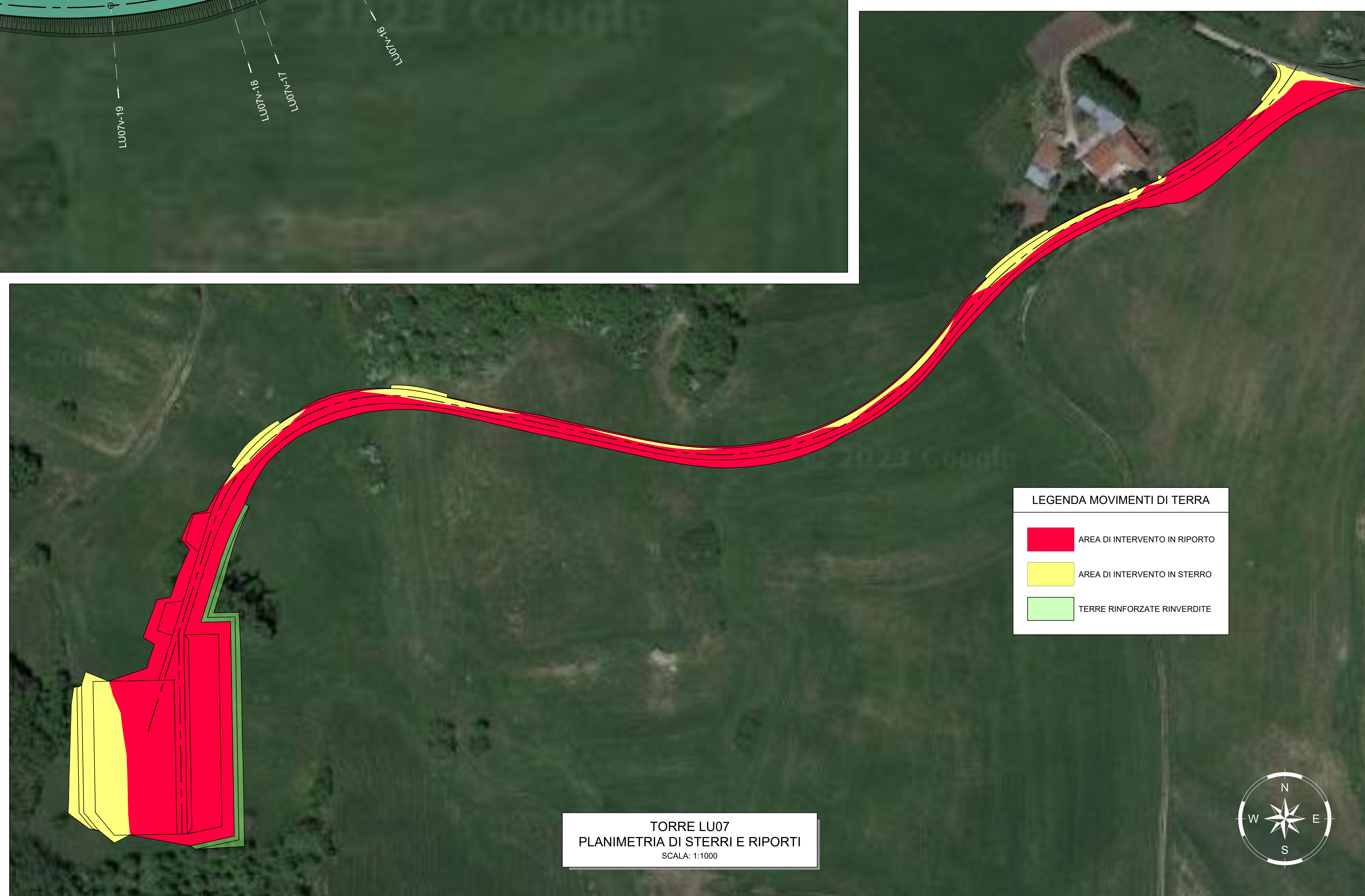
TORRE LU07 PLANIMETRIA DI STERRI E RIPORTI SCALA: 1:1000