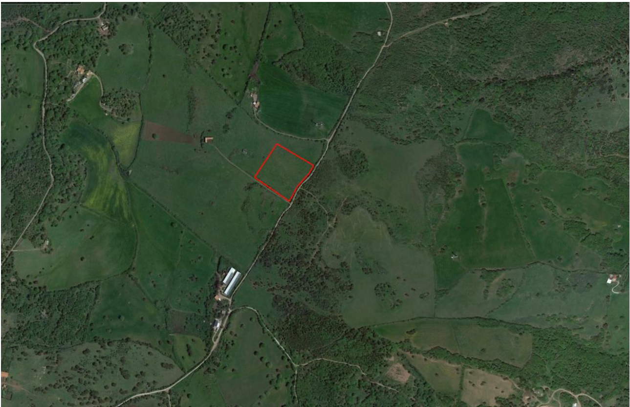
Figura 5.2 – Sito individuato per l’allestimento delle aree di cantiere n. 2 lungo la viabilità da adeguare di accesso alla postazione T08.

Durante la fase costruttiva, la disponibilità di adeguati spazi di conformazione regolare (coincidenti con le piazzole di cantiere) potrà consentire, se necessario ed in funzione delle esigenze dell’appaltatore, la dislocazione di ulteriori apprestamenti (quali locali di ricovero o bagni chimici per il personale) in posizione maggiormente accessibile per i lavoratori rispetto a quelli previsti nell’area di cantiere generale.