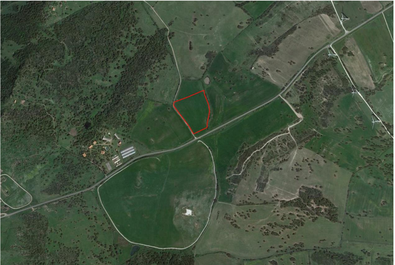
Figura 5.1 – Possibile ubicazione dell’area di cantiere n.1 con annessa area di trasbordo

L’area di cantiere n. 2 trova spazio nel settore centro-meridionale dell’impianto eolico, ubicato tra le postazioni eoliche T08 e T10, nei pressi della viabilità da adeguare della postazione T08, nel territorio comunale di Nulvi. La superficie occupata è di 14.328 m 2 .