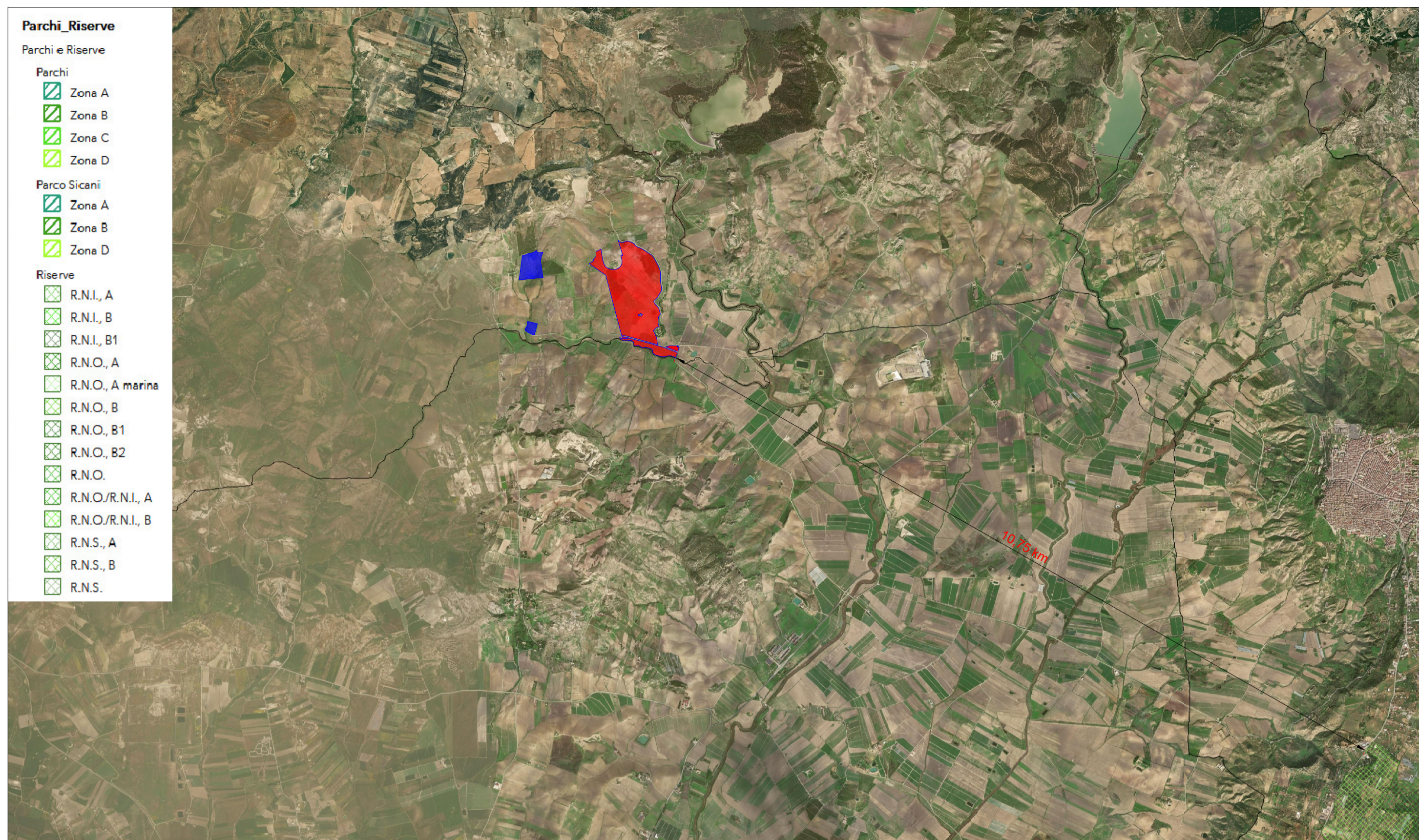
PARCHI E RISERVE SCALA 1:50.000