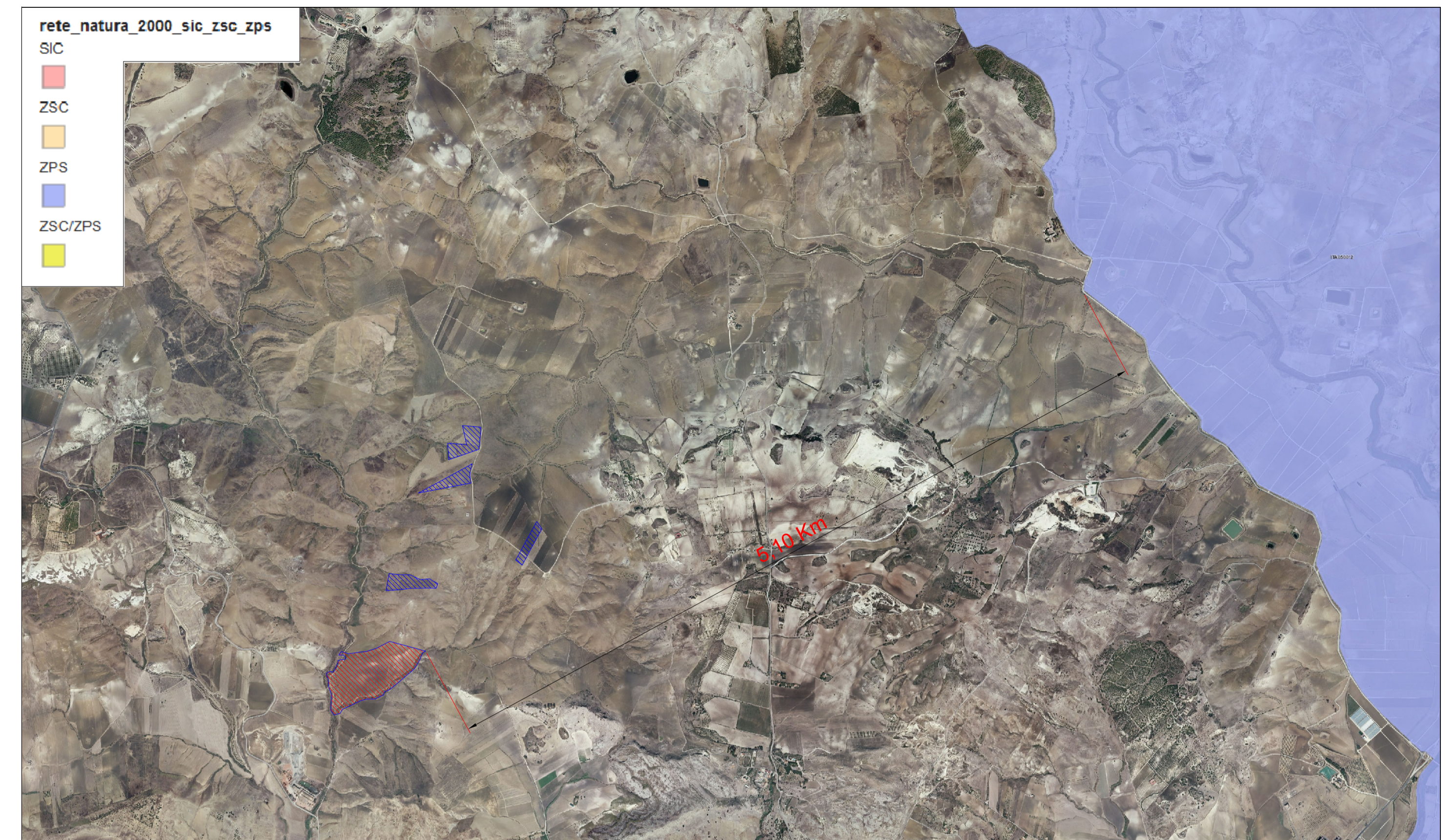
AREE SIC E ZPS SCALA 1:10.000