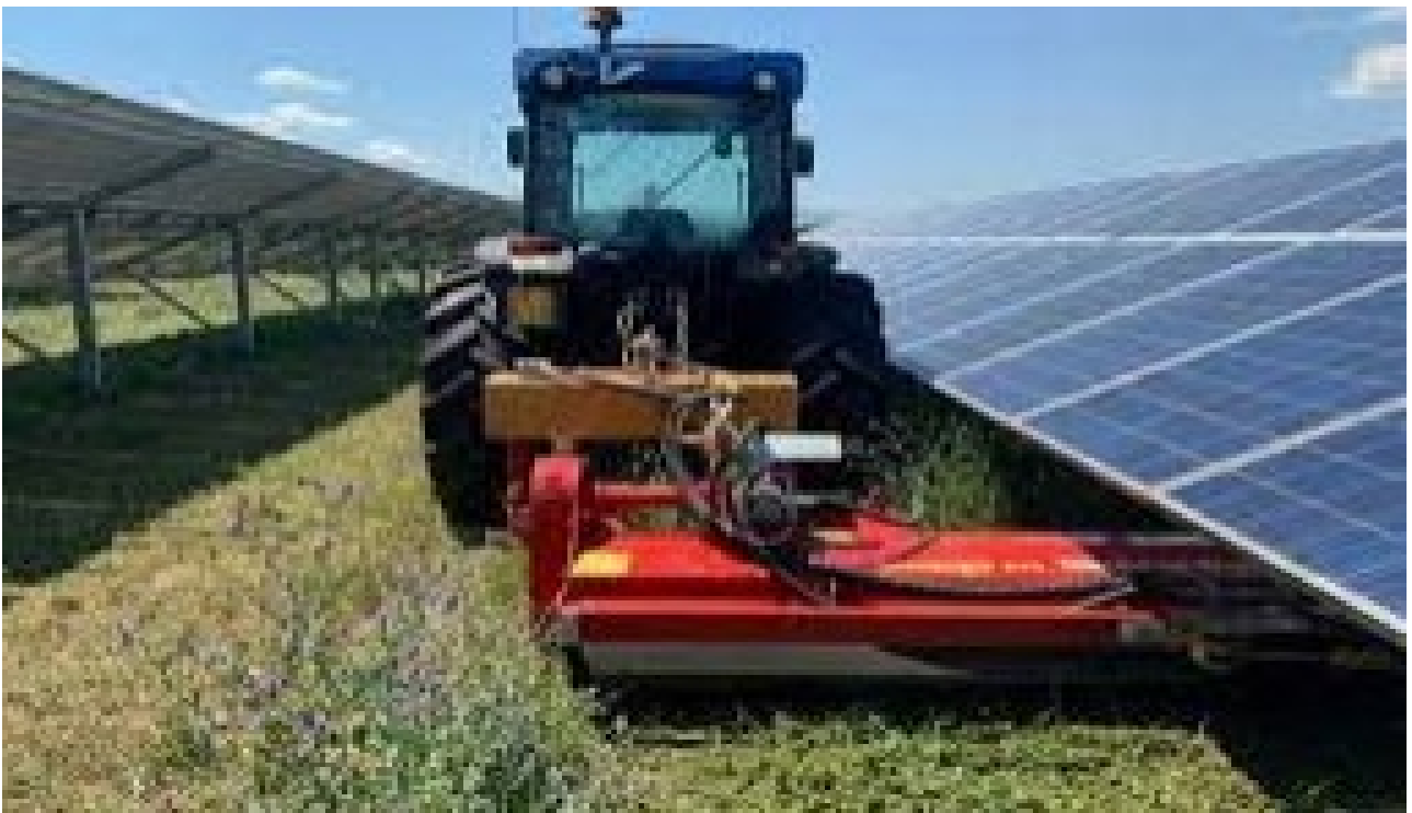
Figura 3 – Tosaerba azionata da una trattrice

Consiste nel rivestire il terreno con una copertura erbacea, controllata tramite sfalci senza la raccolta dell'erba tritata (Figura 1 – Figura 2).