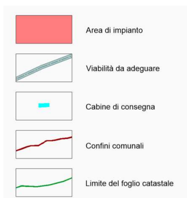
Figura 3 - Inquadramento dell'area di impianto su Catastale