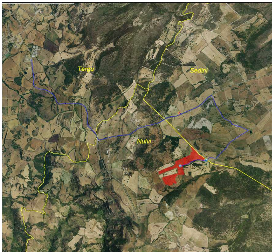
Figura 1 - Inquadramento dell'area di impianto su ortofoto