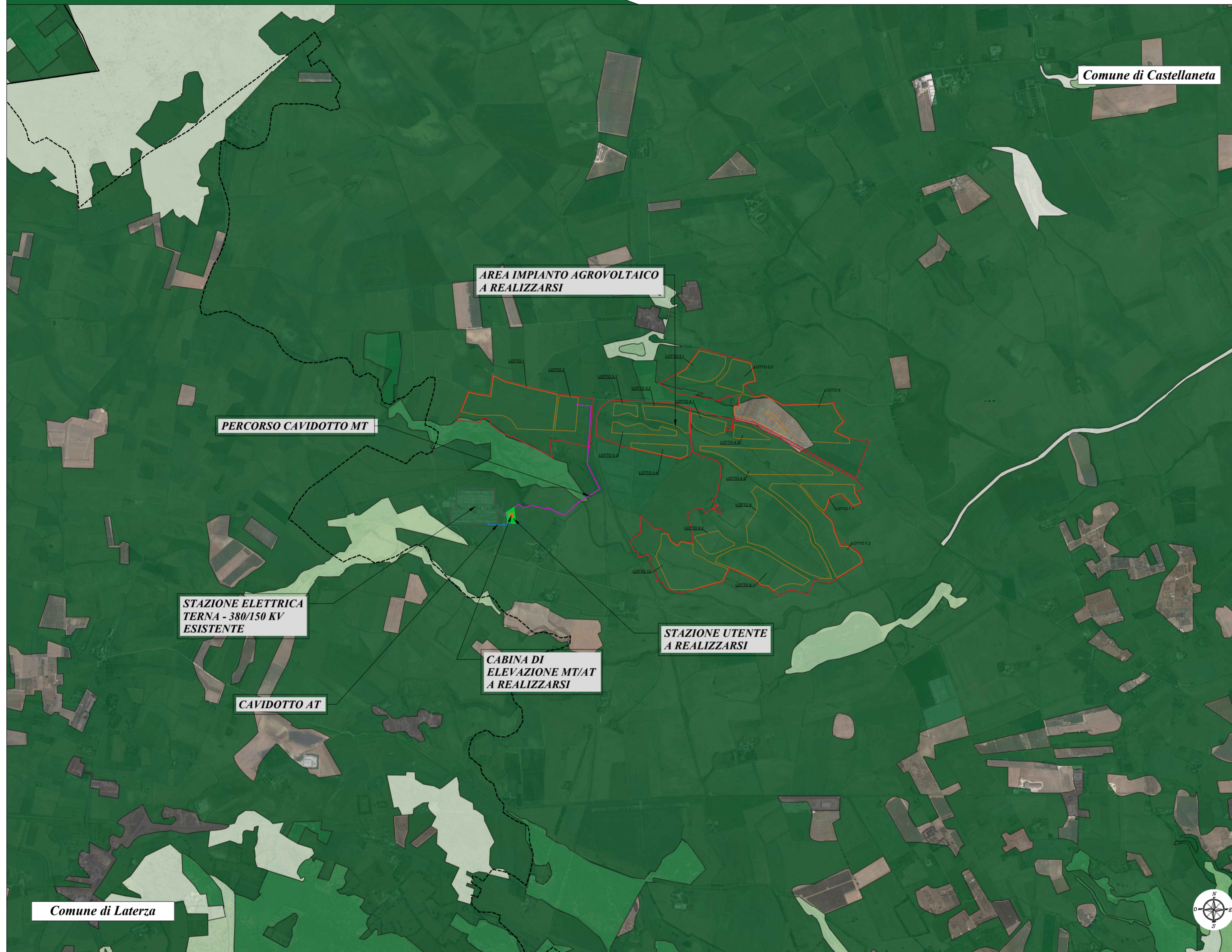
Carta della vegetazione - Scala 1:20.000