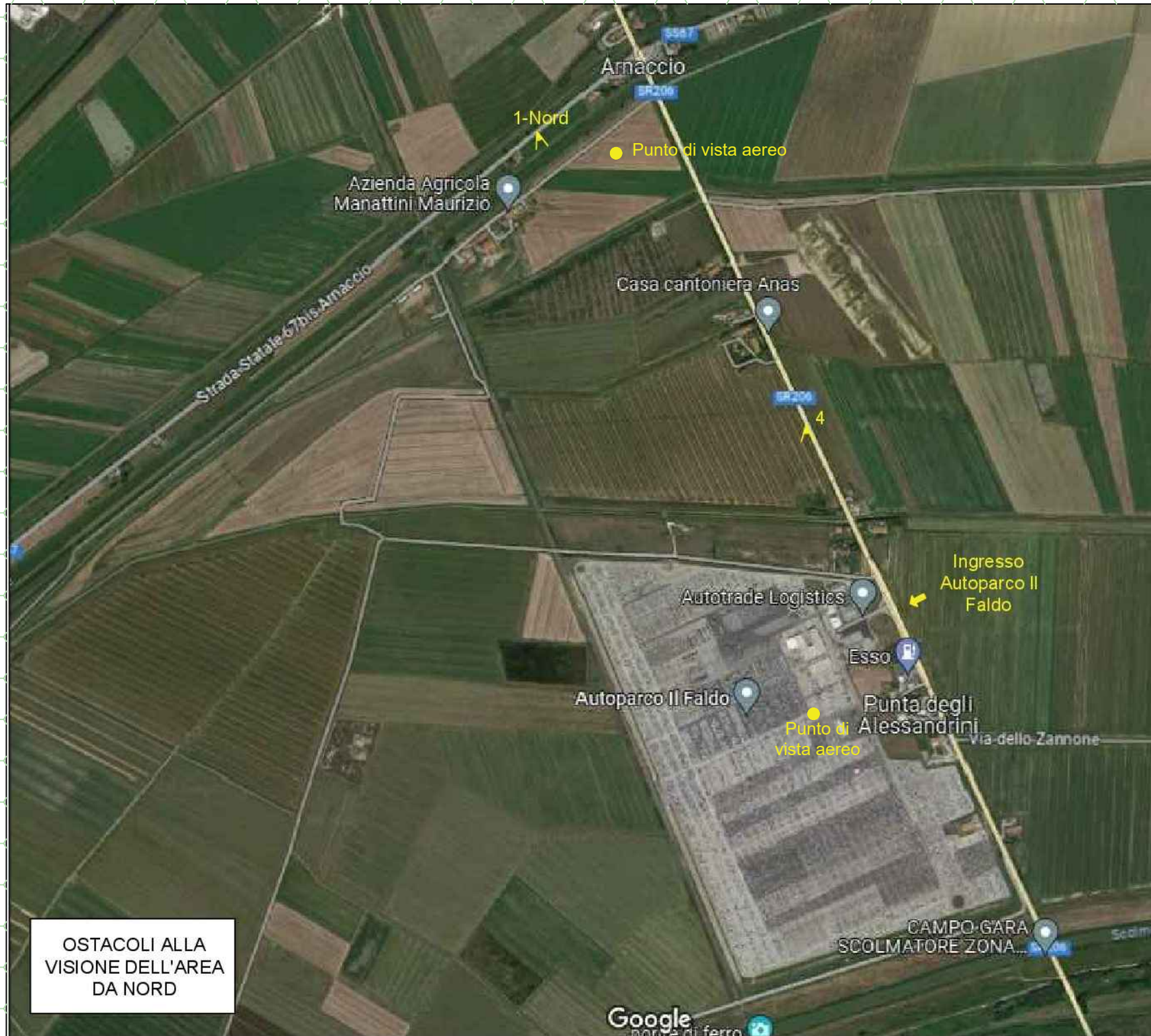
OSTACOLI ALLA VISIONE DELL'AREA DA NORD