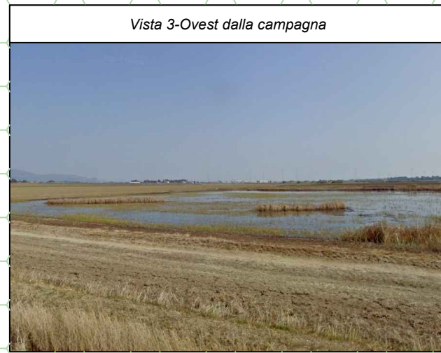
Vista 3-Ovest dalla campagna