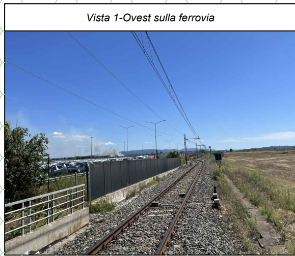
Vista 1-Ovest sulla ferrovia