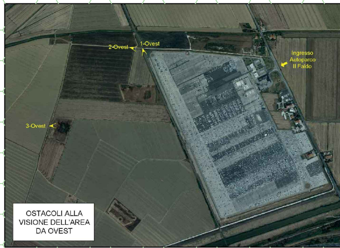
OSTACOLI ALLA VISIONE DELL'AREA DA OVEST