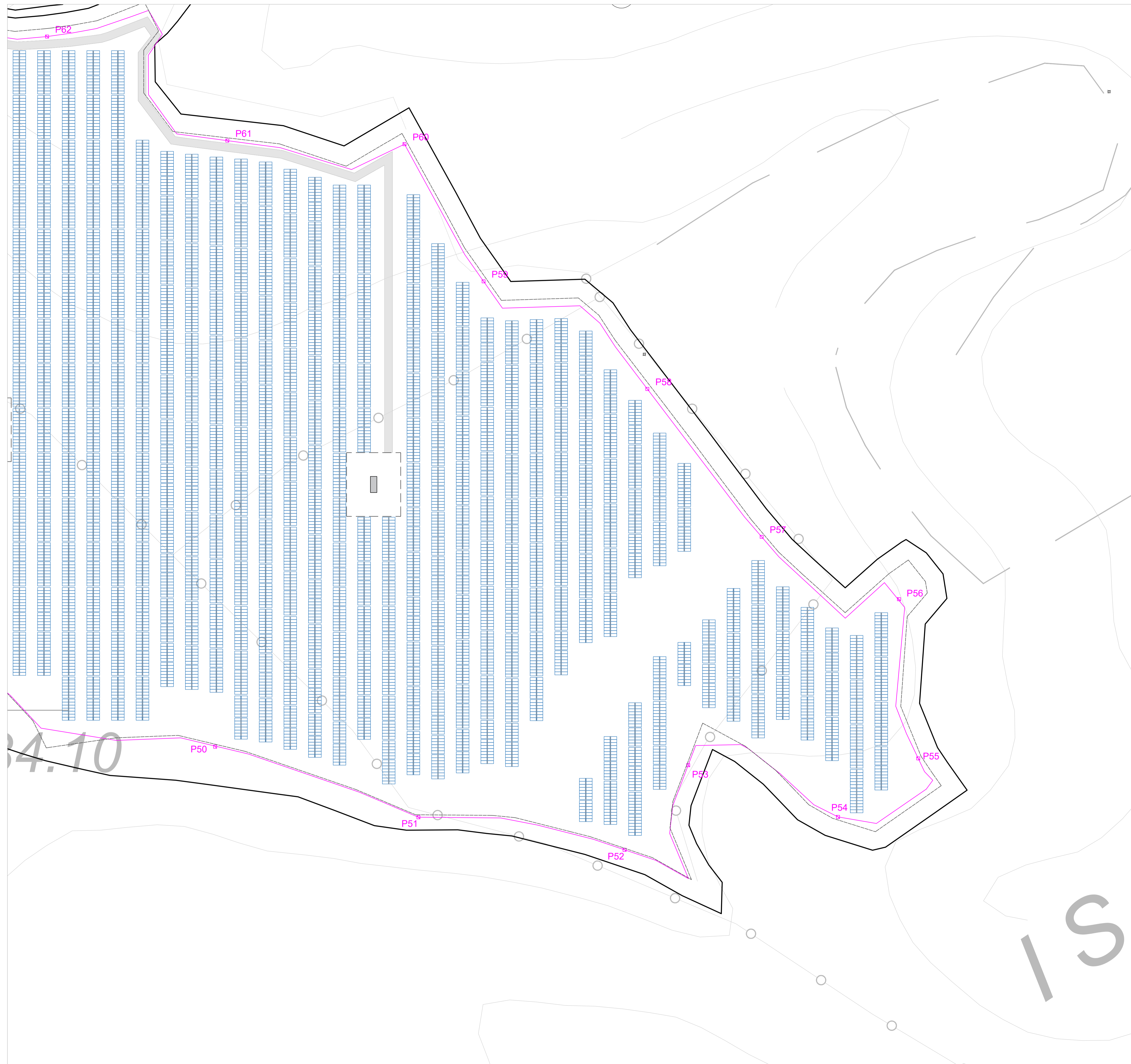
PLANIMETRIA - SISTEMA DI ILLUMINAZIONE_Scala 1_1000