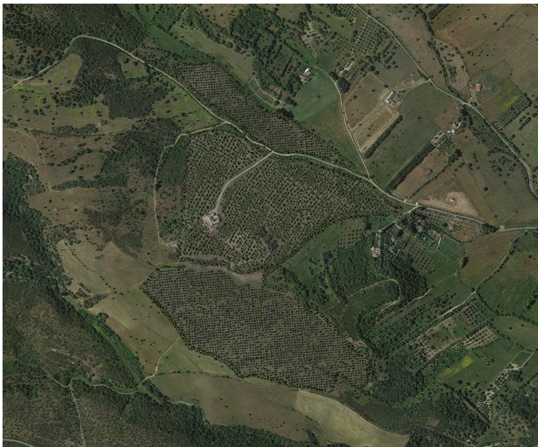
Fig 3: Planimetria ripristino ambientale post-operam.

Le azioni necessarie per l'attuazione di tali obiettivi sono: