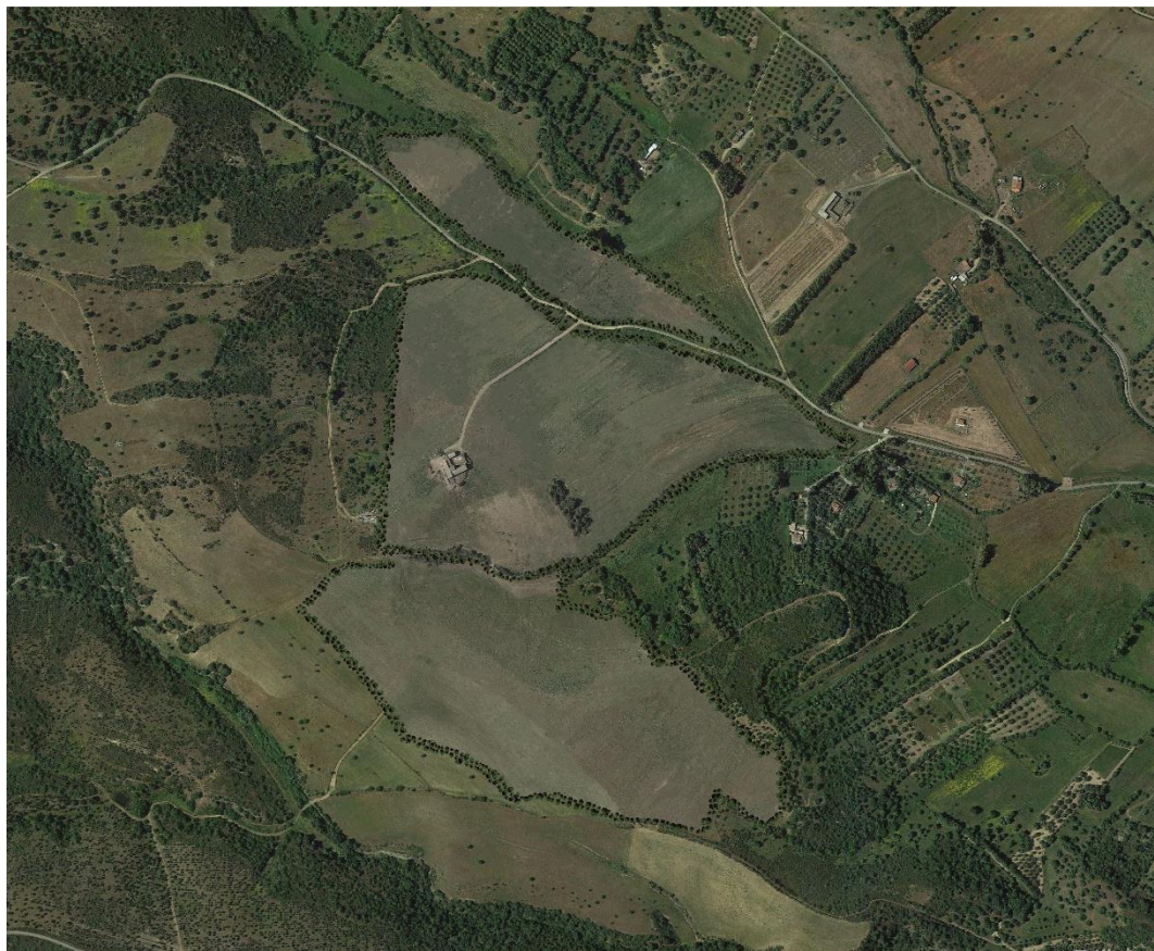
Fig 2: Planimetria durante la dismissione dell'impianto.