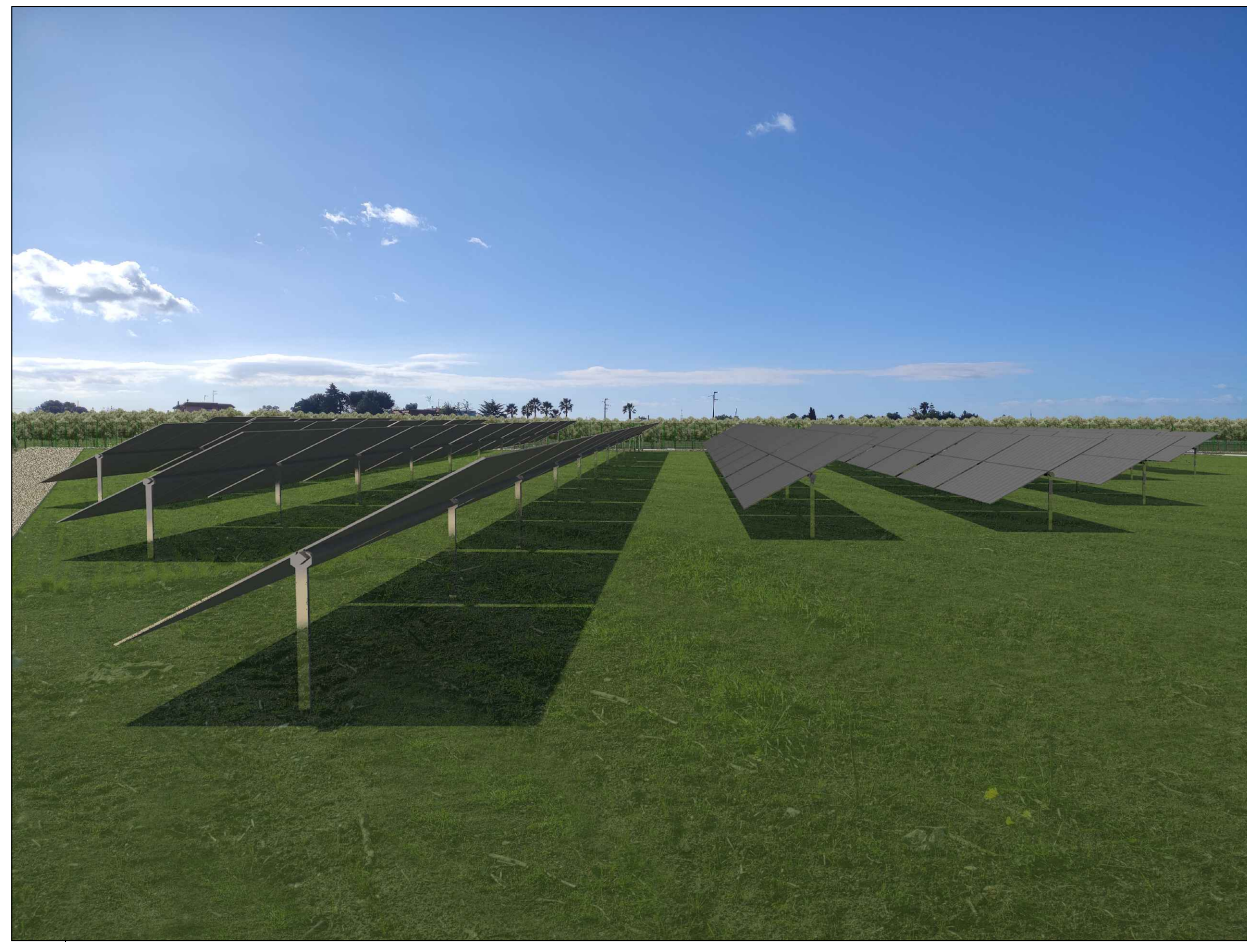
VISTA PUNTO 1