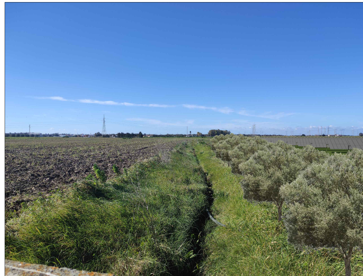
VISTA PUNTO 4