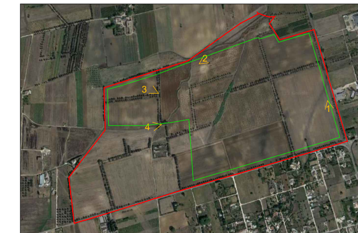
Inquadramento territoriale con coni ottici