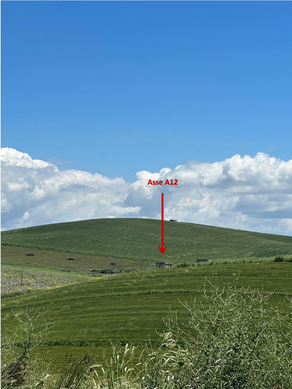
Stato dei luoghi A12