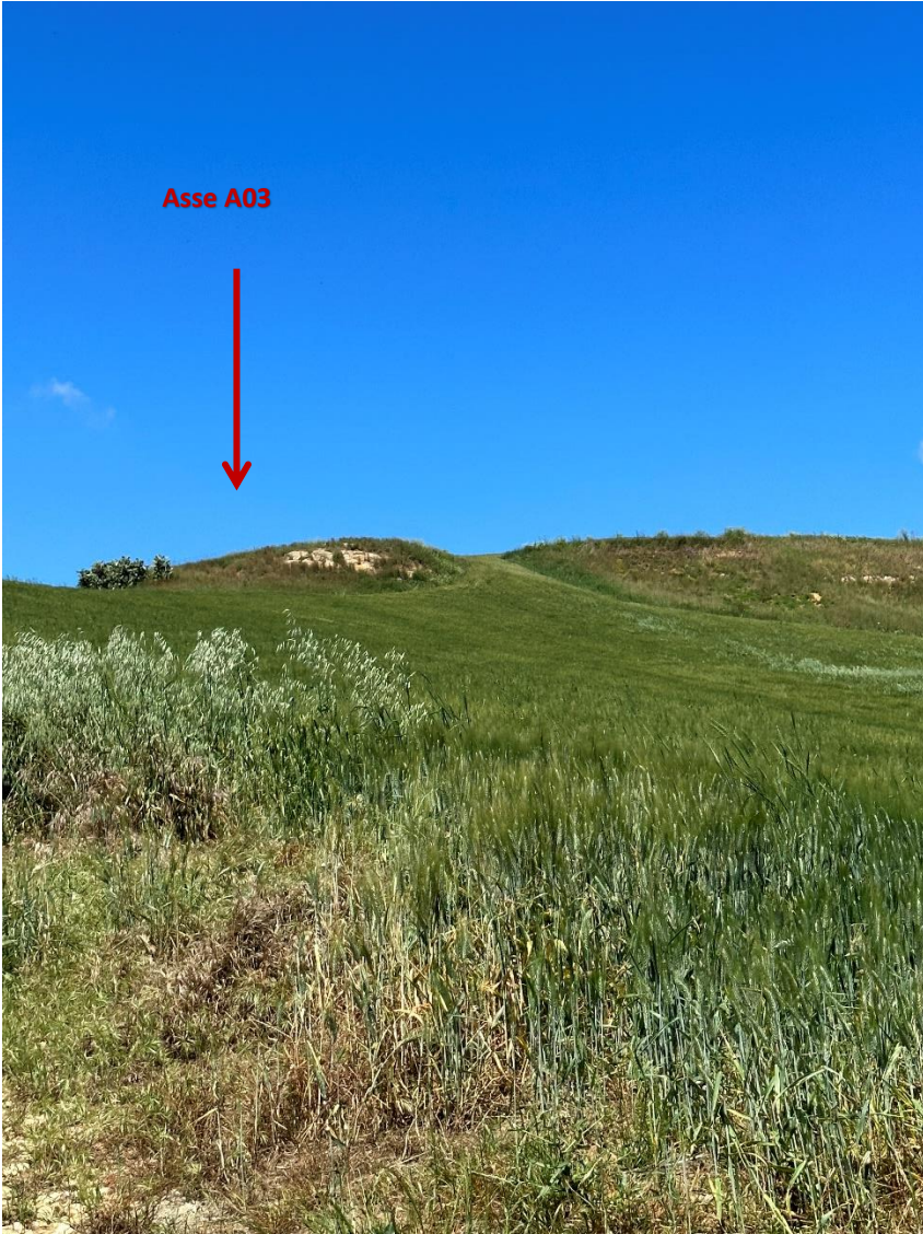
Stato dei luoghi A03