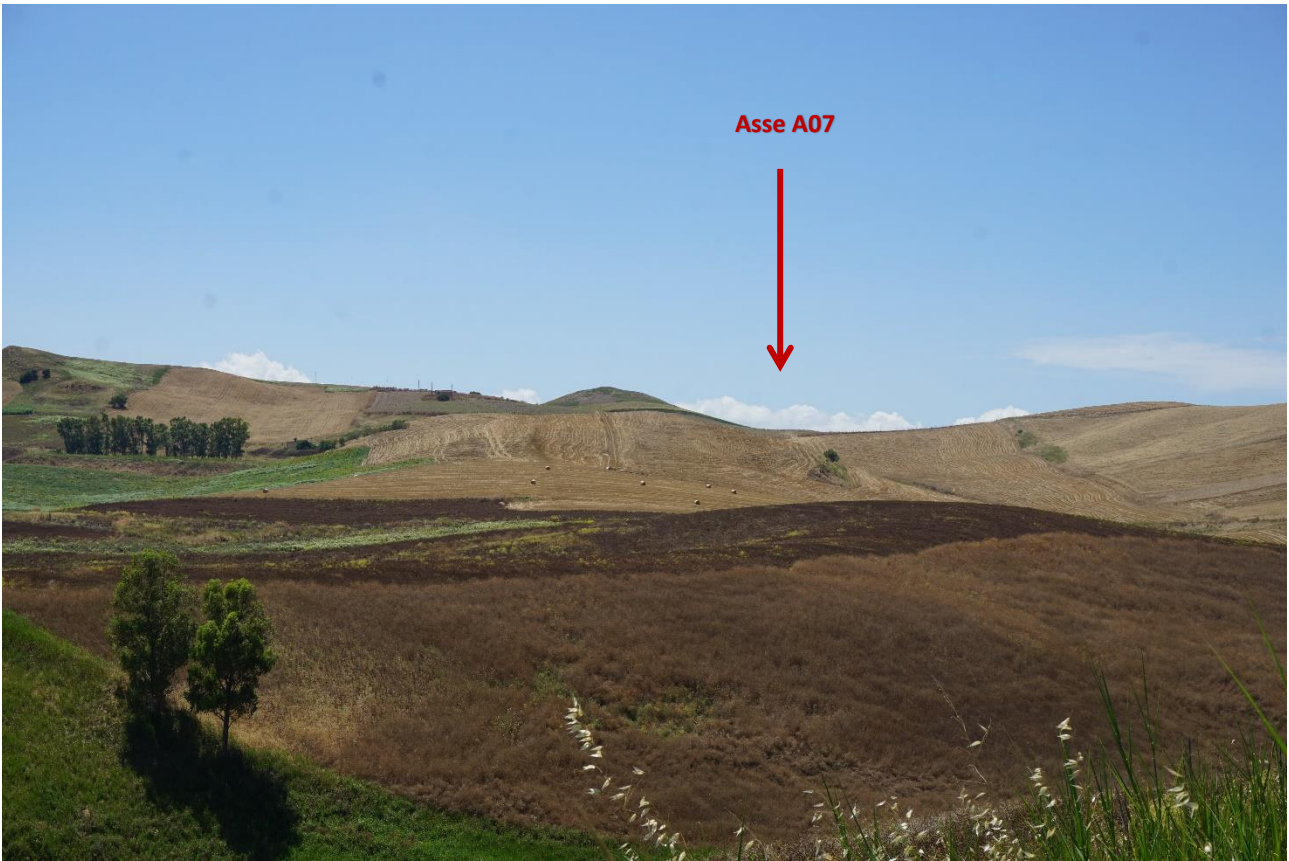
Stato dei luoghi A07