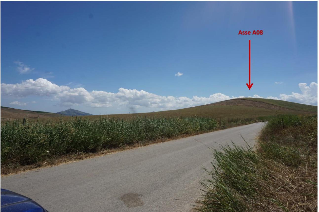
Stato dei luoghi A08