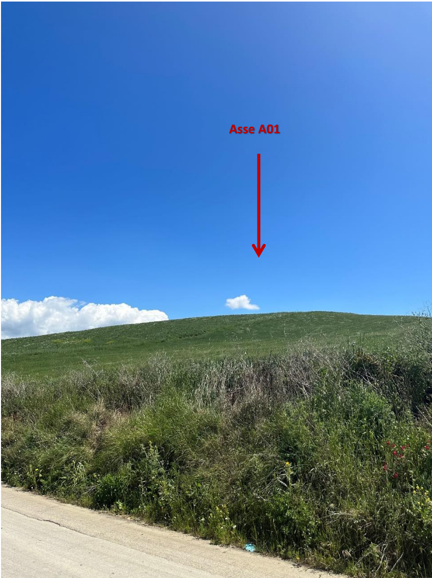
Stato dei luoghi A01