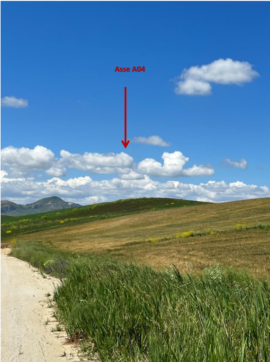
Stato dei luoghi A04