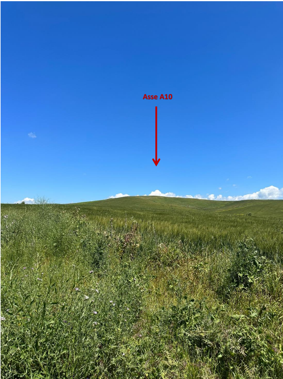
Stato dei luoghi A10