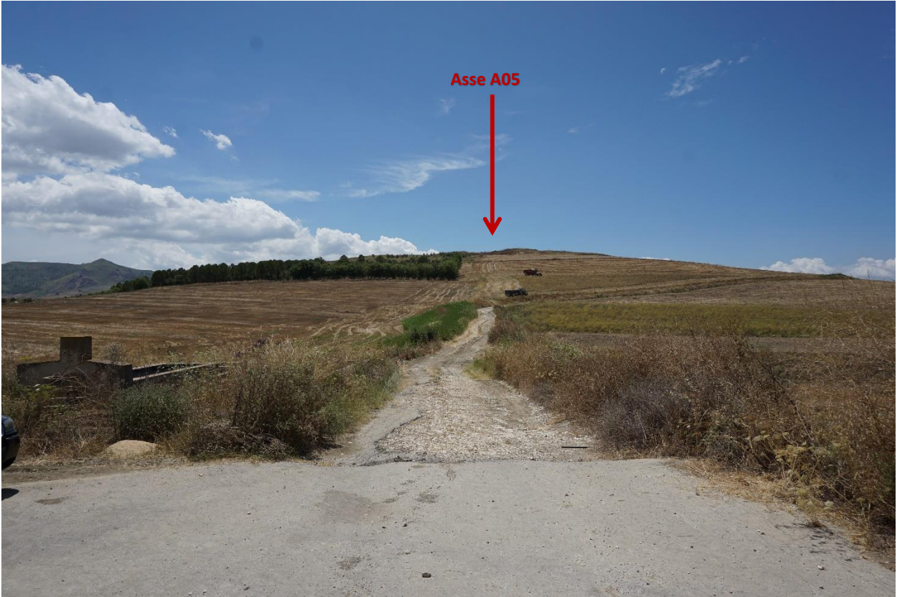
Stato dei luoghi A05