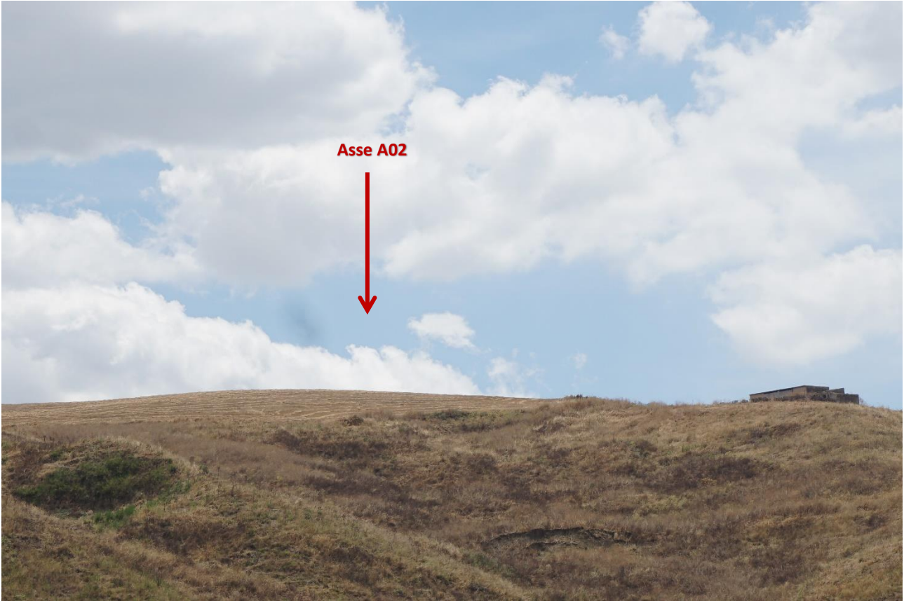
Stato dei luoghi A02