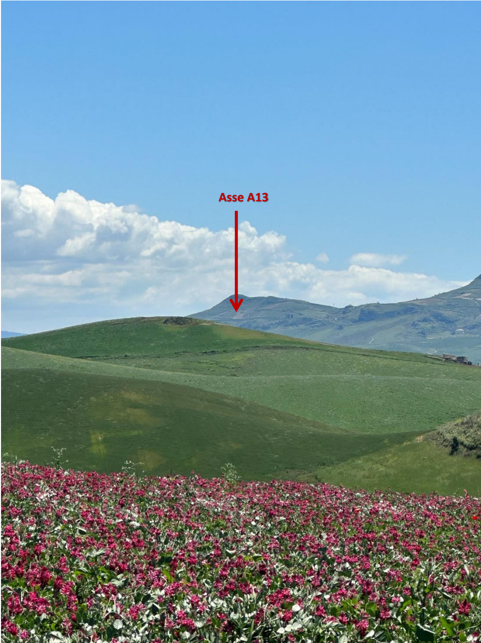
Stato dei luoghi A13