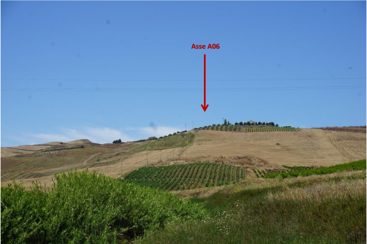
Stato dei luoghi A06