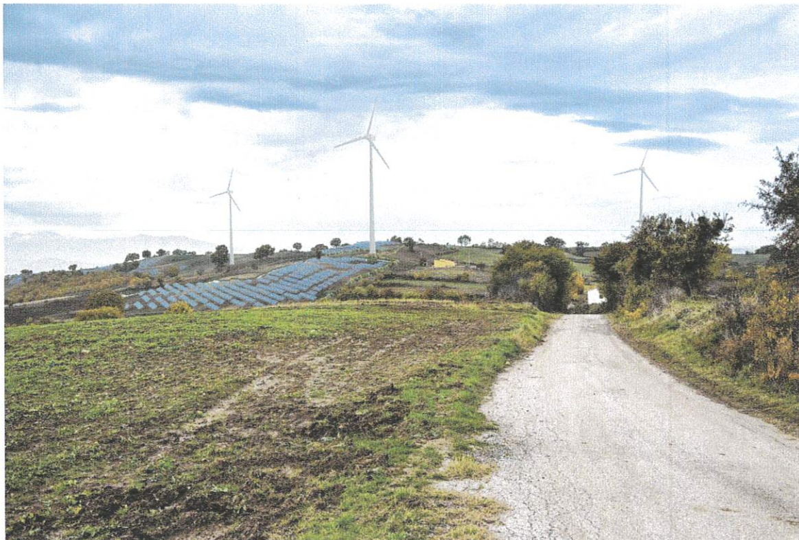
Figura 4 - foto-simulazione Vista V01 (da elaborato 06-RP - Relazione tecnico paesaggistica pag. 87)

CONSIDERATO E VALUTATO che, in riferimento agli aspetti archeologici , la Soprintendenza Abap della Basilicata, come meglio esplicitato sopra, ha rilevato una serie di carenze nella documentazione prodotta dal proponente in relazione al potenziale archeologico dell'area interessata dall'intervento proposto, confermata dal Servizio II della DG Abap.