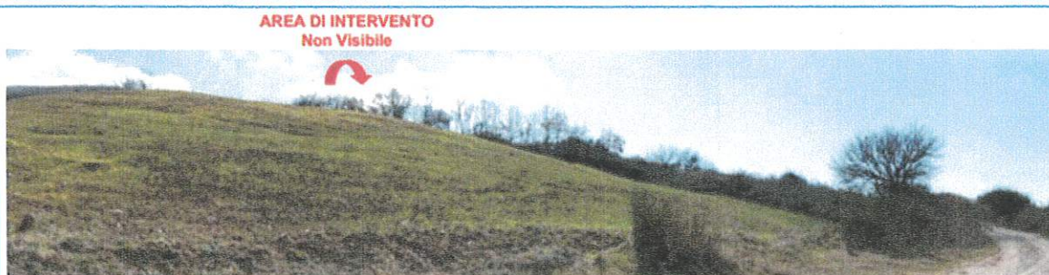
Figura 8: Vista POST OPERAM dal PS03, Masseria Difesa Monte Scardaccione

Figure 2 e 3 - stralci Elaborato "Reportage fotografico ante e post operam"