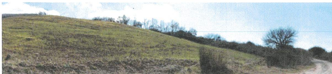
Figura 7: Vista ANTE OPERAM dal PS03, Masseria Difesa Monte Scardaccione