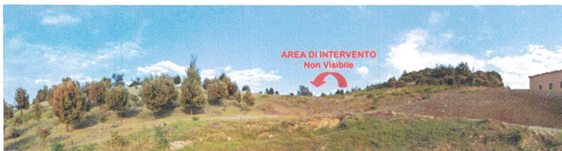
Figura 45: Vista POST OPERAM dal PS16, Abbazia di Santa Maria d'Orsoleo a Sant'Arcangelo