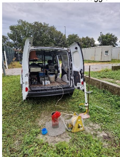
Pz1: spurgo piezometro e campionamento