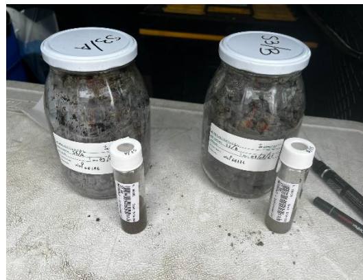
S3: campioni di terreno