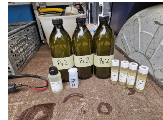
Pz2: campioni delle acque sotterranee