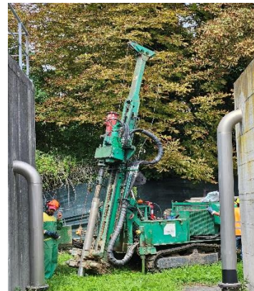
S4: ubicazione sondaggio