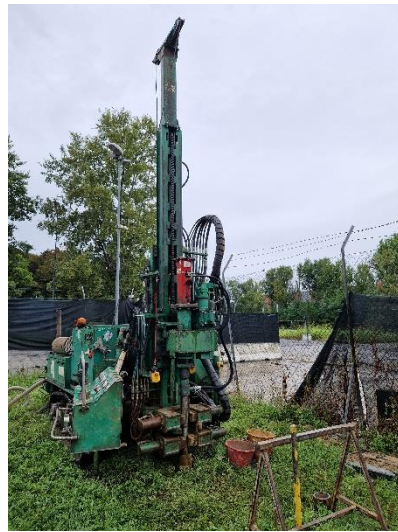
Pz1: ubicazione sondaggio