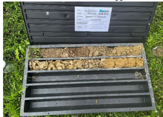
S2: cassetta catalogatrice (0,00 – 2,00 m)