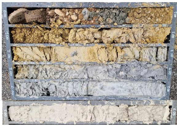
Pz1: cassetta catalogatrice (0,00 – 6,00 m)