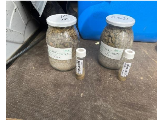
S1: campioni di terreno