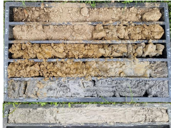
Pz1: cassetta catalogatrice (0,00 – 6,00 m)