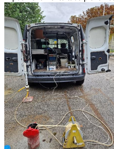
Pz2: spurgo piezometro e campionamento