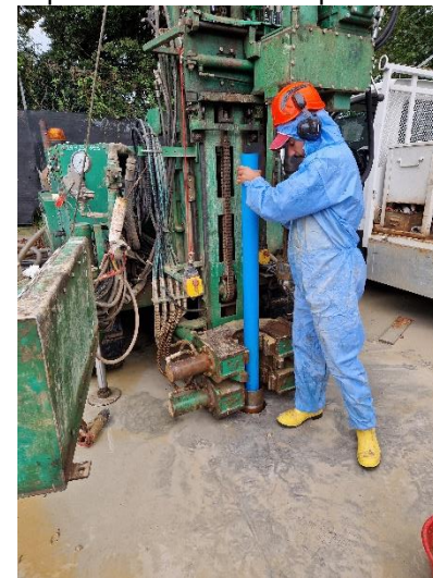
Pz1: posizionamento tubo piezometrico