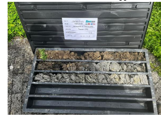
S3: cassetta catalogatrice (0,00 – 3,00 m)