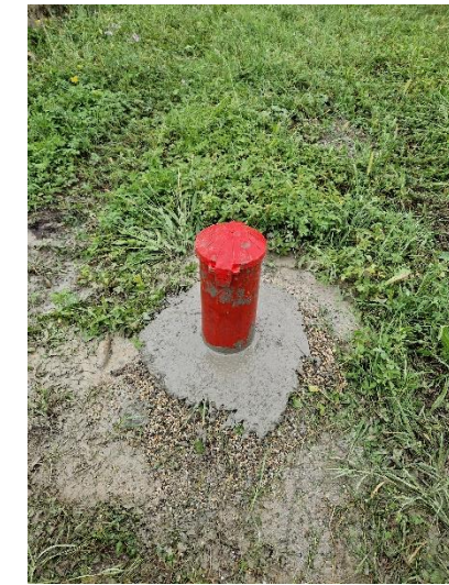
Pz1: funghetto posto a chiusura del piezometro