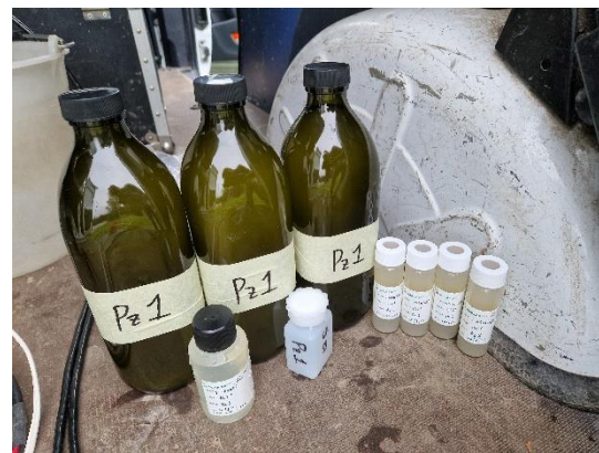
Pz1: campioni delle acque sotterranee