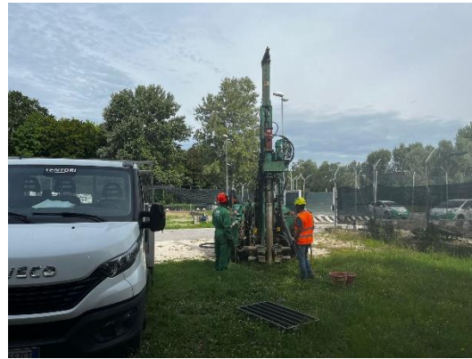
S1: ubicazione sondaggio