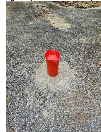
Pz2: funghetto posto a chiusura del piezometro