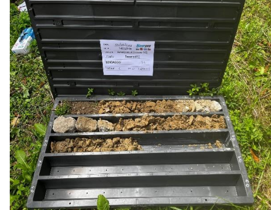
S4: cassetta catalogatrice (0,00 – 2,50 m)