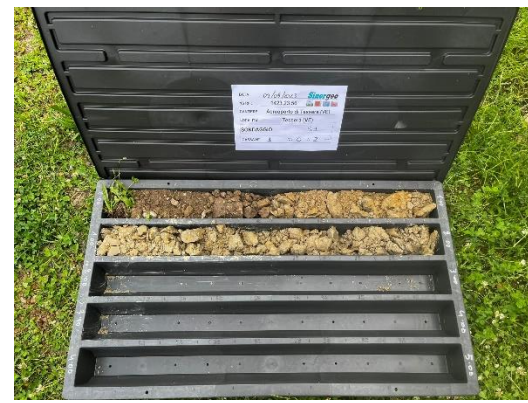
S1: cassetta catalogatrice (0,00 – 2,00 m)