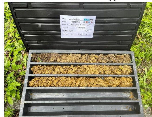
S5: cassetta catalogatrice (0,00 – 3,00 m)