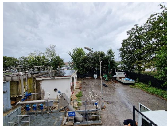
Pz2: ubicazione sondaggio