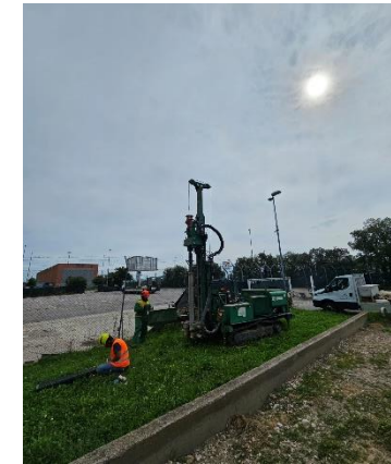
S2: ubicazione sondaggio