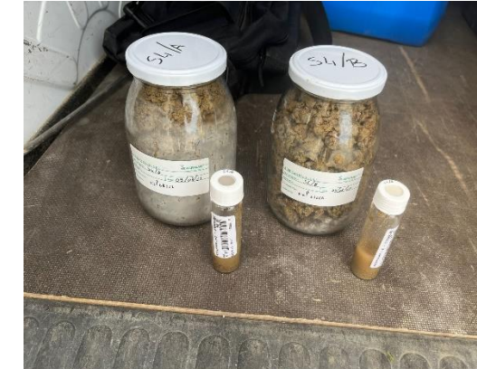
S4: campioni di terreno