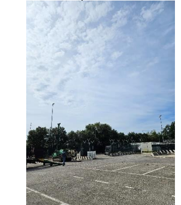
Visione di contesto dell'impianto