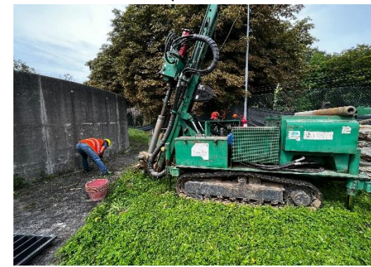
S3: ubicazione sondaggio