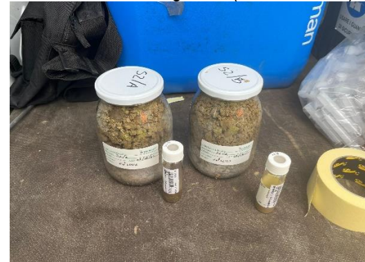
S2: campioni di terreno