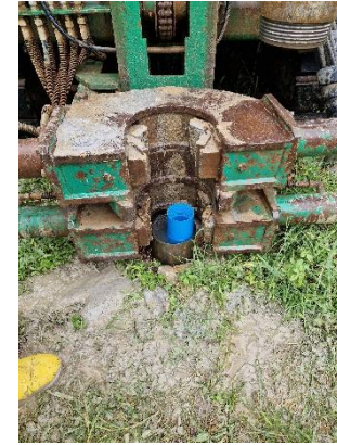
Pz1: posizionamento tubo piezometrico