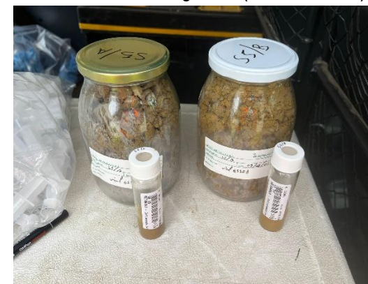
S5: campioni di terreno