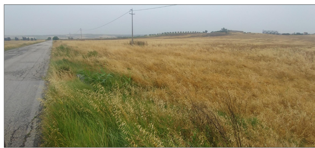
VISTA 10 VISTA STATO ATTUALE