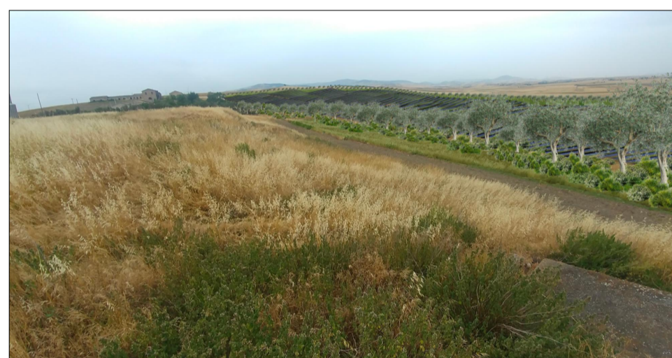
VISTA 8 FOTOINSERIMENTO STATO FUTURO