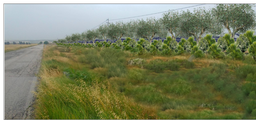
VISTA 10 VISTA STATO FUTURO (CON MITIGAZIOE)