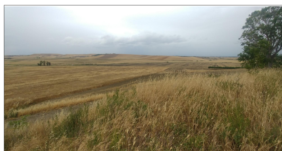
VISTA 7 STATO ATTUALE