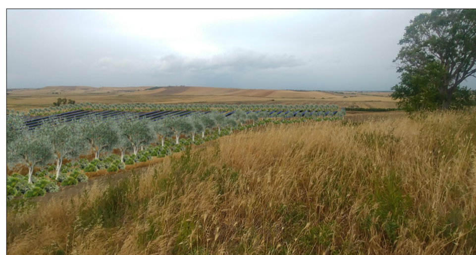
VISTA 7 FOTOINSERIMENTO STATO FUTURO