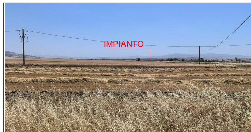
VISTA 3 - RESTI DEL MONUMENTO FUNERARIO ANTICO DI EPOCA ROMANA