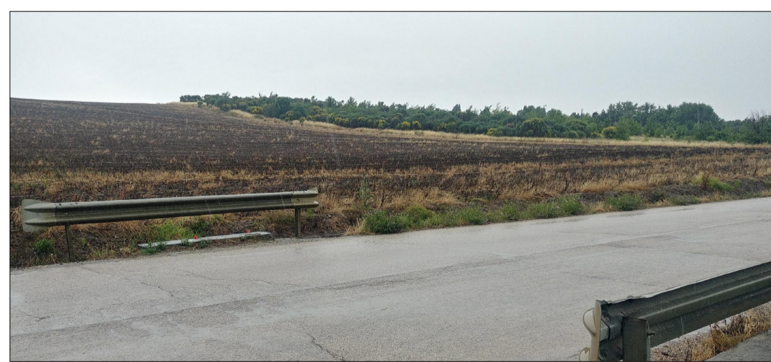
VISTA 9 VISTA STATO ATTUALE