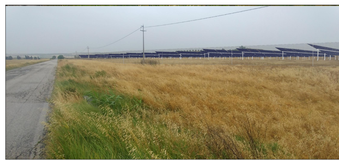
VISTA 10 VISTA STATO FUTURO (SENZA MITIGAZIOE)