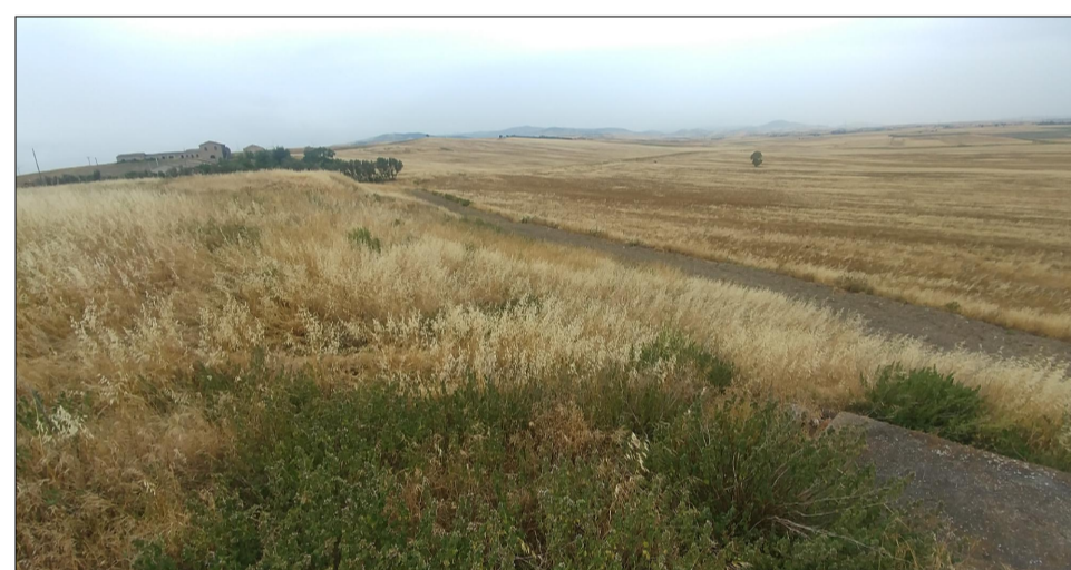
VISTA 8 STATO ATTUALE