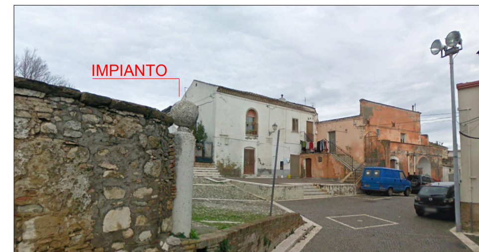
VISTA 5 - PALAZZO DUCALE