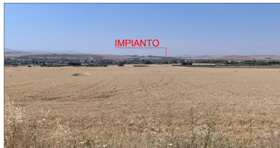
VISTA 1 - RESTI DI EDIFICI PUBBLICI ACARATTERE SACRO E CIVILE