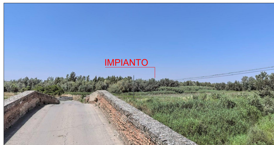
VISTA 2 - PONTE ROMANO