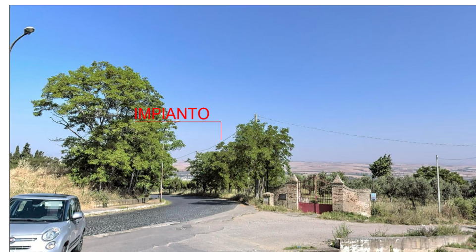
VISTA 4 - CHIESA DI S. MARIA DEL POPOLO