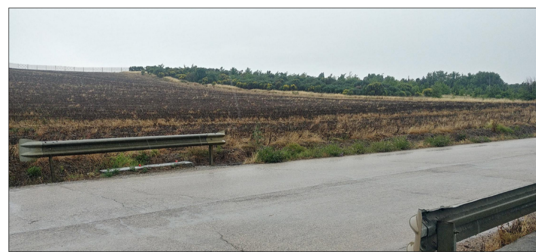
VISTA 9 VISTA STATO FUTURO (SENZA MITIGAZIOE)