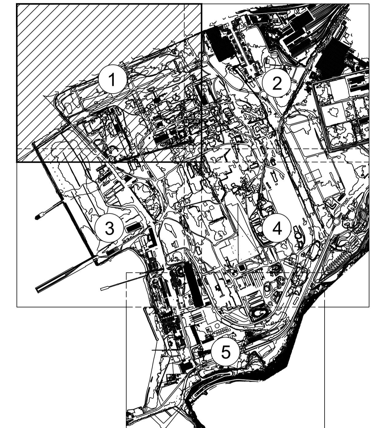
QUADRO DI UNIONE