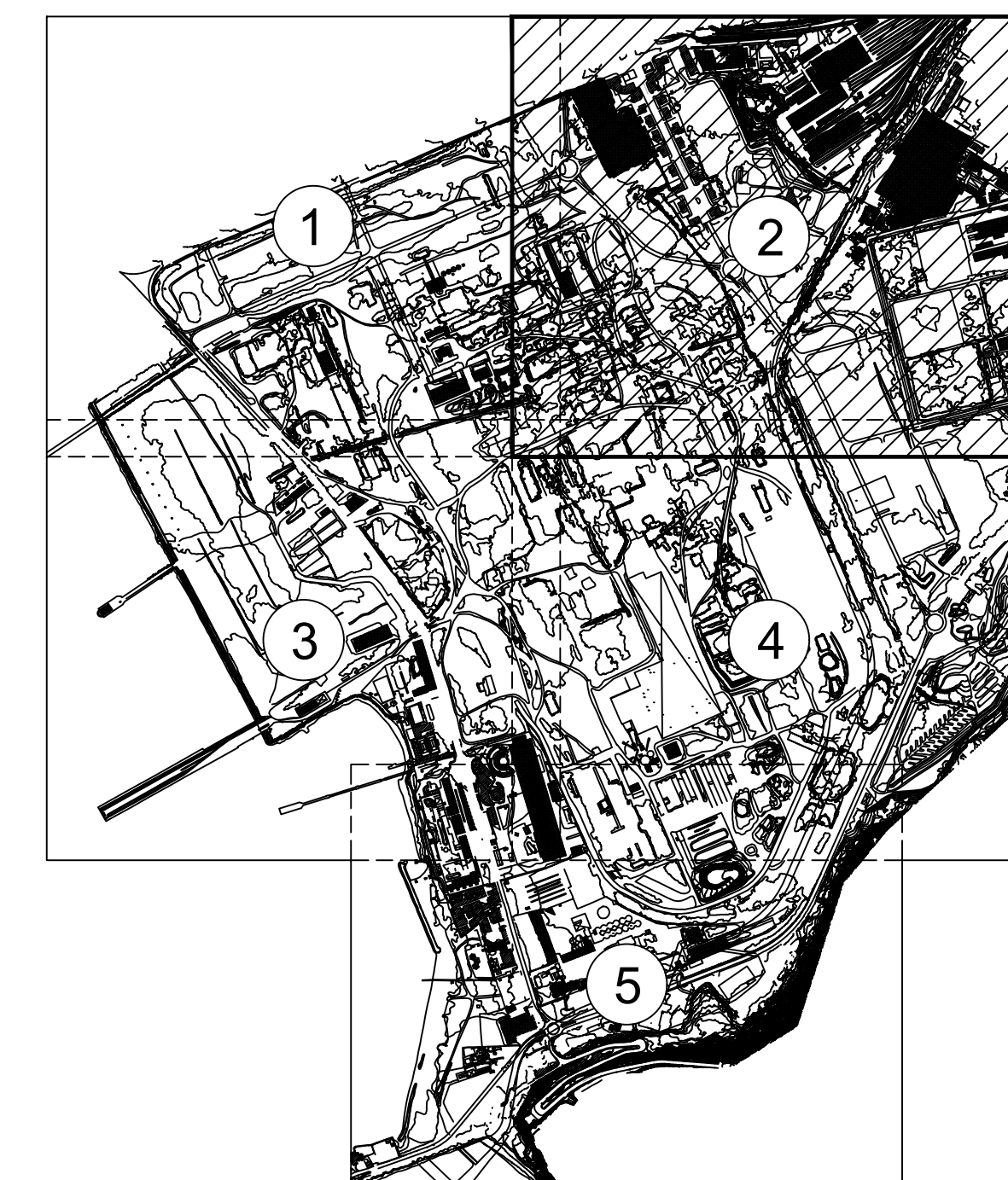
QUADRO DI UNIONE