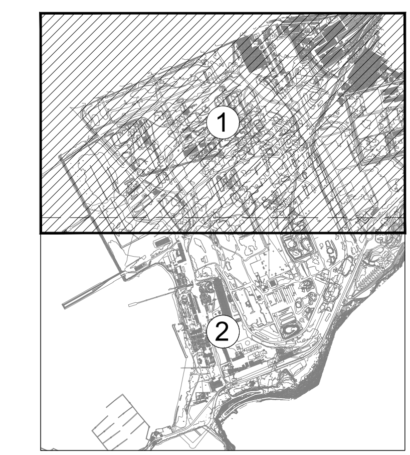
QUADRO DI UNIONE