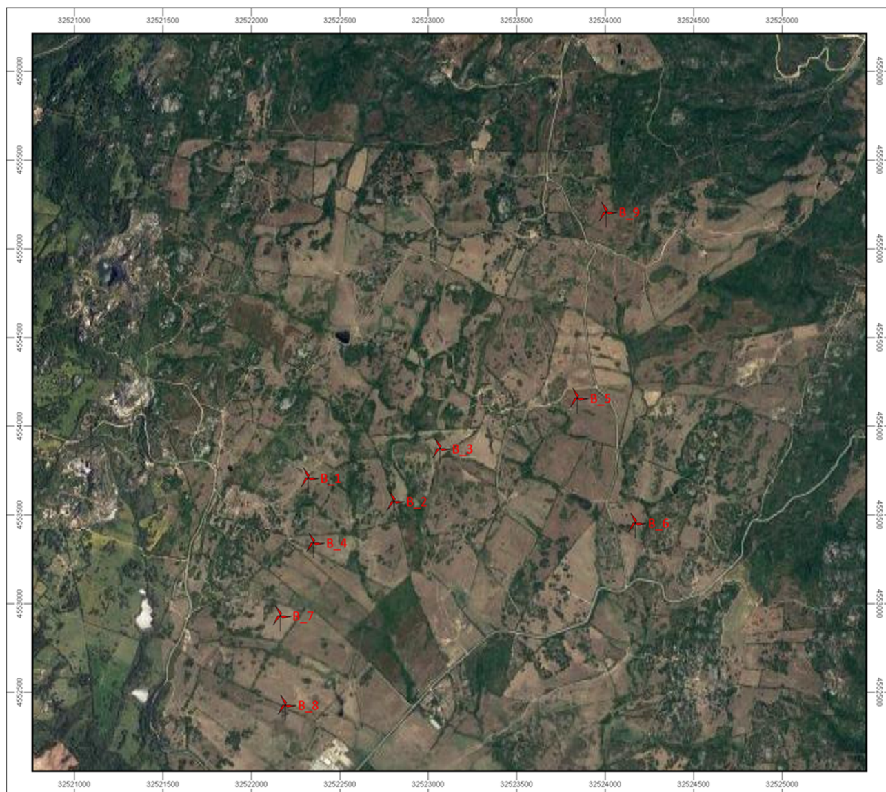
Figura 1 - Planimetria generale dell'intervento con posizione delle turbine

Il territorio adiacente alla Frazione presa in esame è costituito da un'ampia piana solo parzialmente coltivata, in cui si estendono ampie aree adibite a pascolo e seminativo, percorsa dal Riu di Junco ed intervallata da settori alberati e a macchia impenetrabile, abitazioni sparse e presenza di piccoli agglomerati abitativi, alcune cave di granito ed un'area industriale posta a sud rispetto al layout dei n. 9 generatori eolici proposti (cfr. figura 1 ).