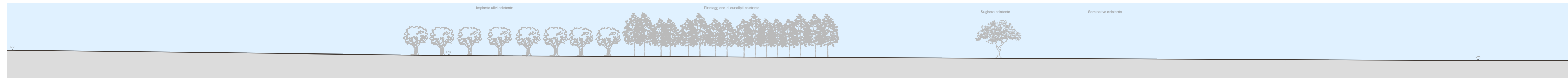
Prospetto C-C' stato di progetto - Scala 1:500