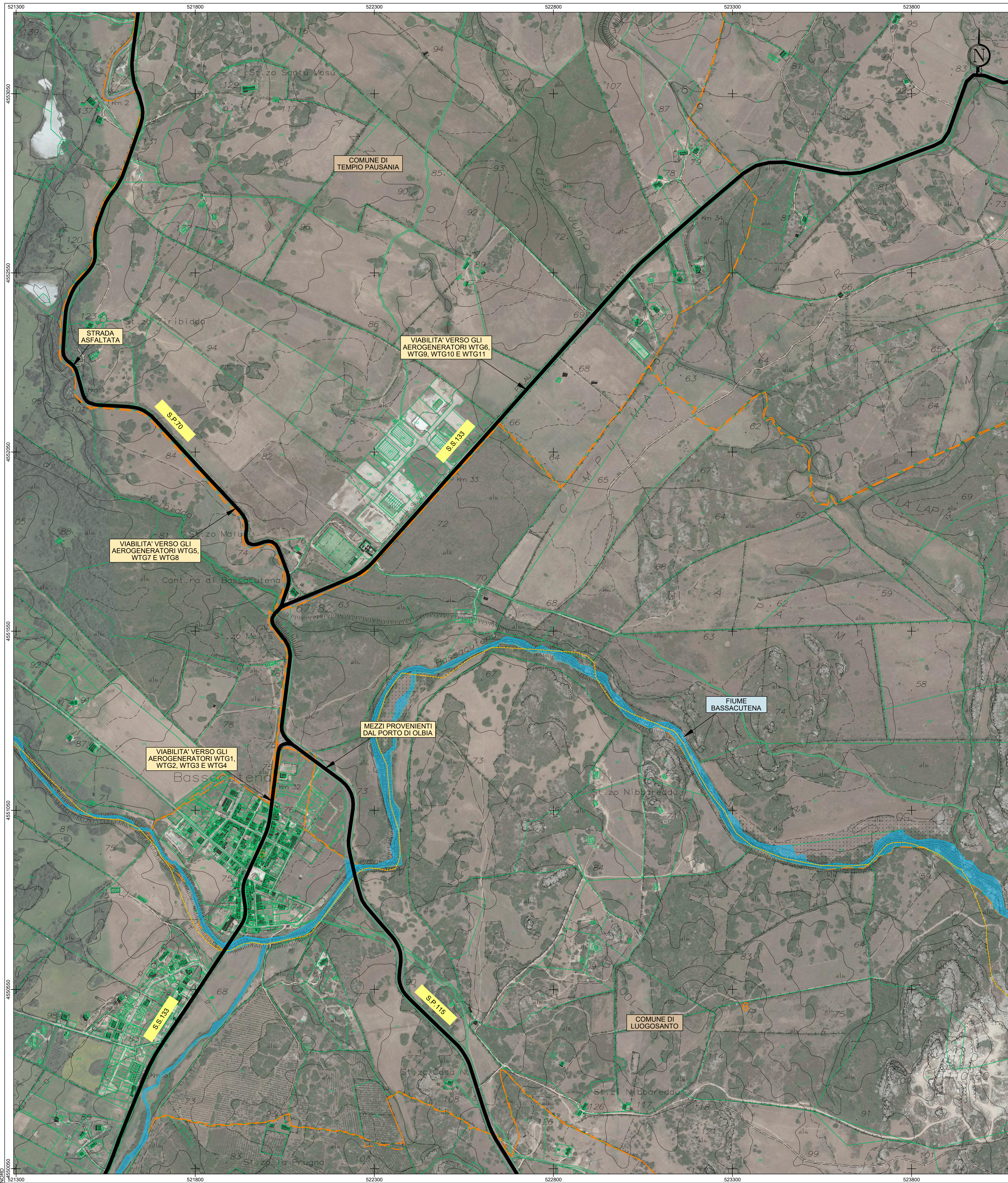
PLANIMETRIA DI PROGETTO: TAVOLA C Base carta: Carta Tecnica Regionale 1:10.000 e Ortofoto Google Map