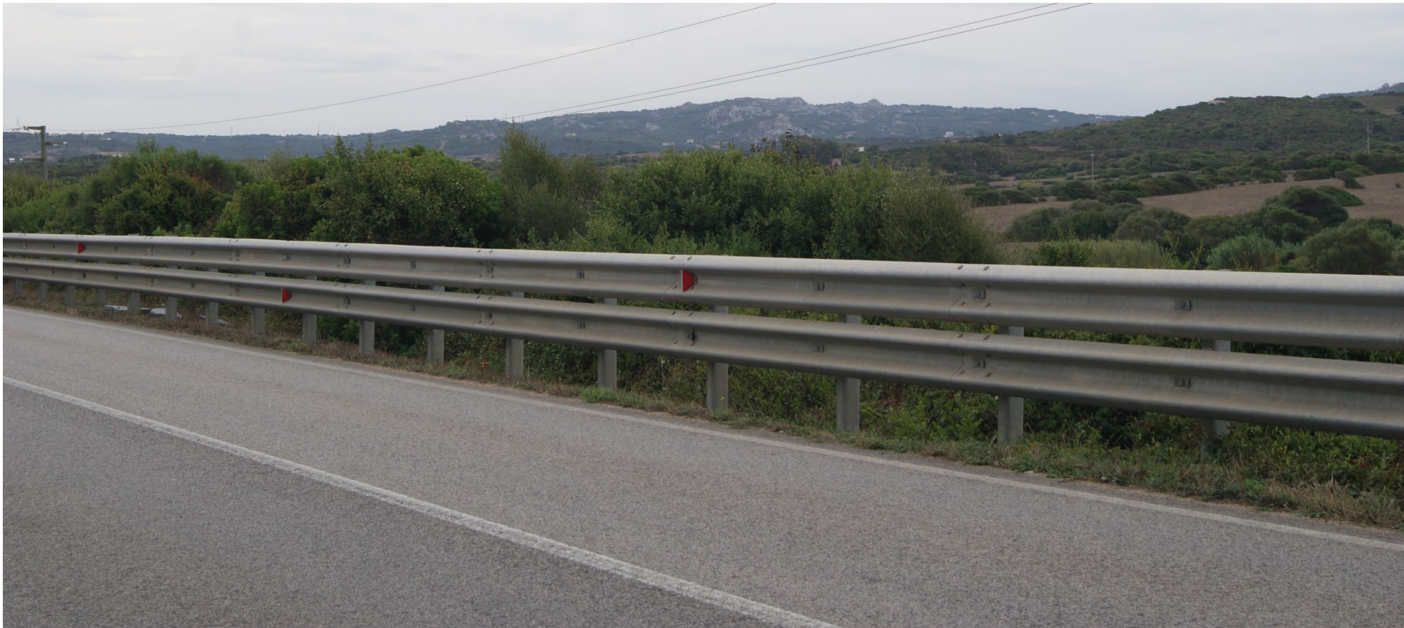
Stato di progetto

PS9_VISTA - SS133 bis per Porto Pozzo – Palau – Stato di fatto