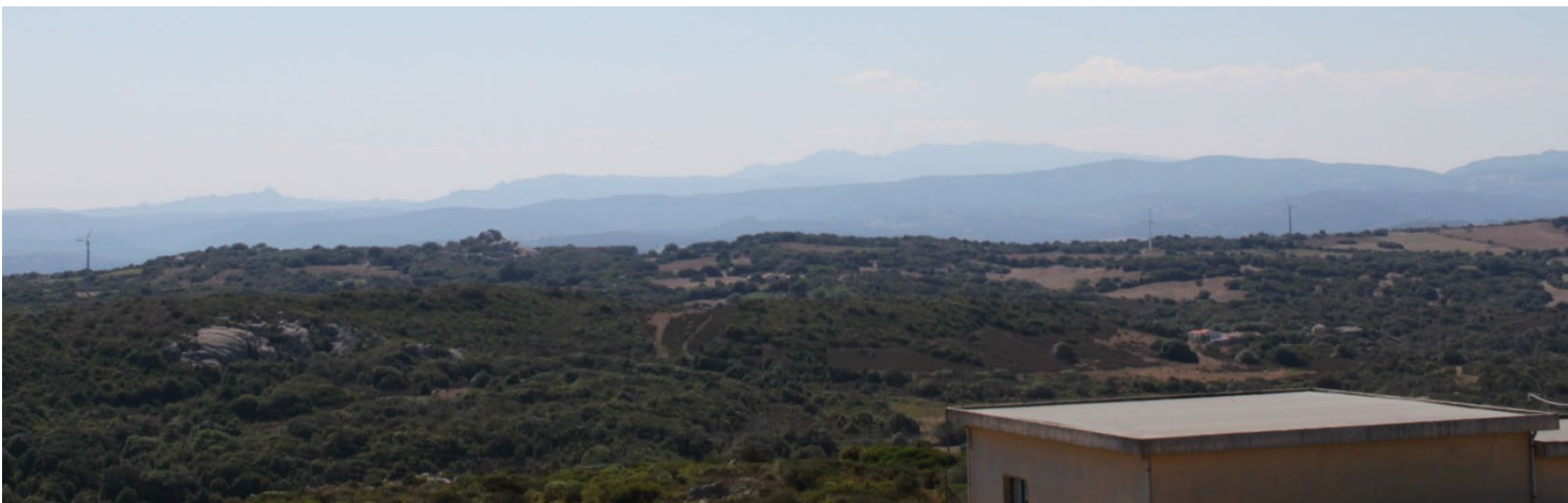
Stato di progetto