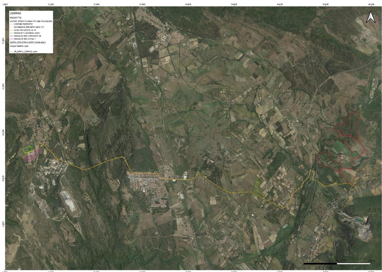
Figura 1: Inquadramento Impianto Agrofotovoltaico e connessione su ortofoto