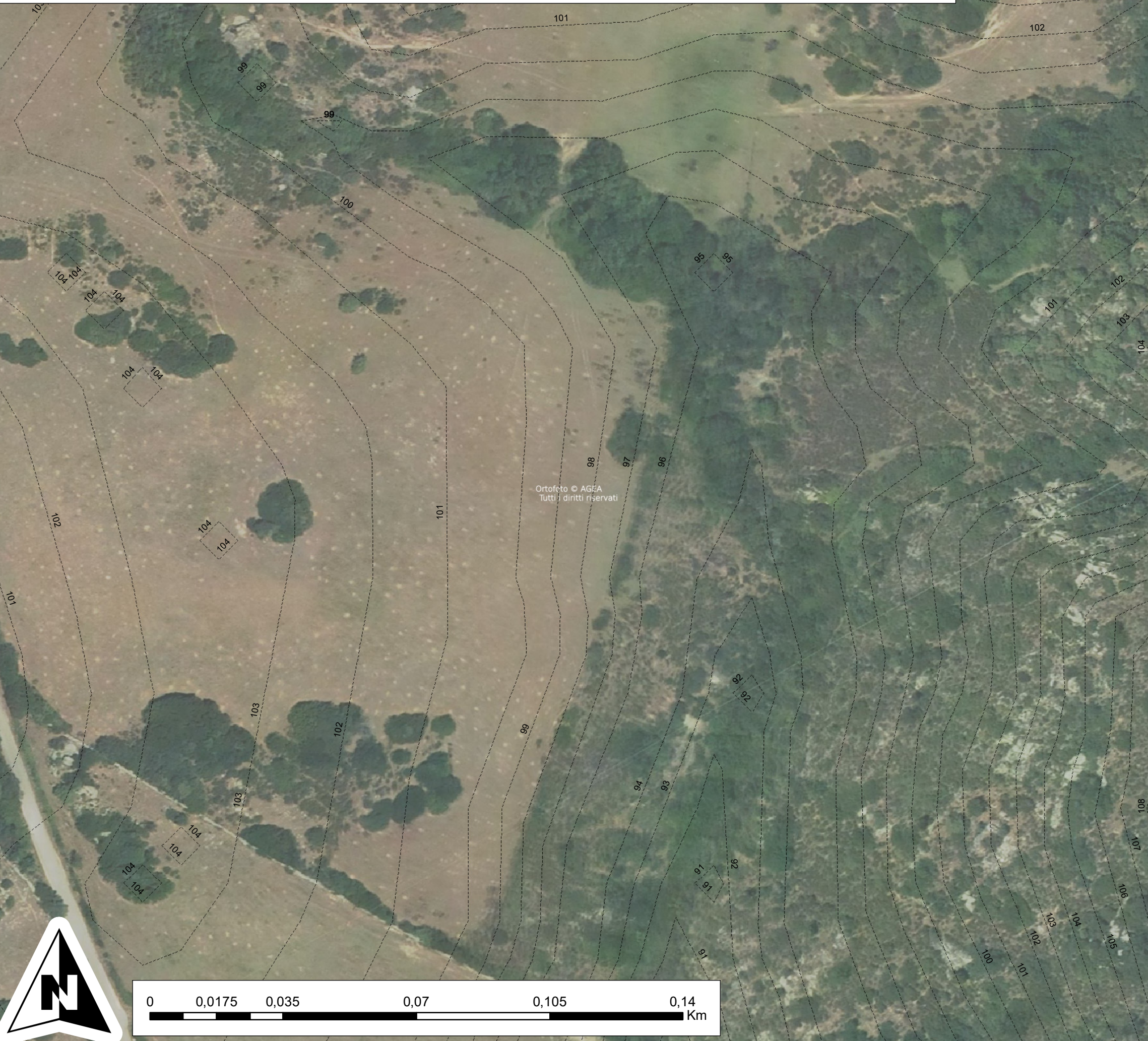
4. Planimetria del ripristino dello stato dei luoghi - Scala 1:1.000