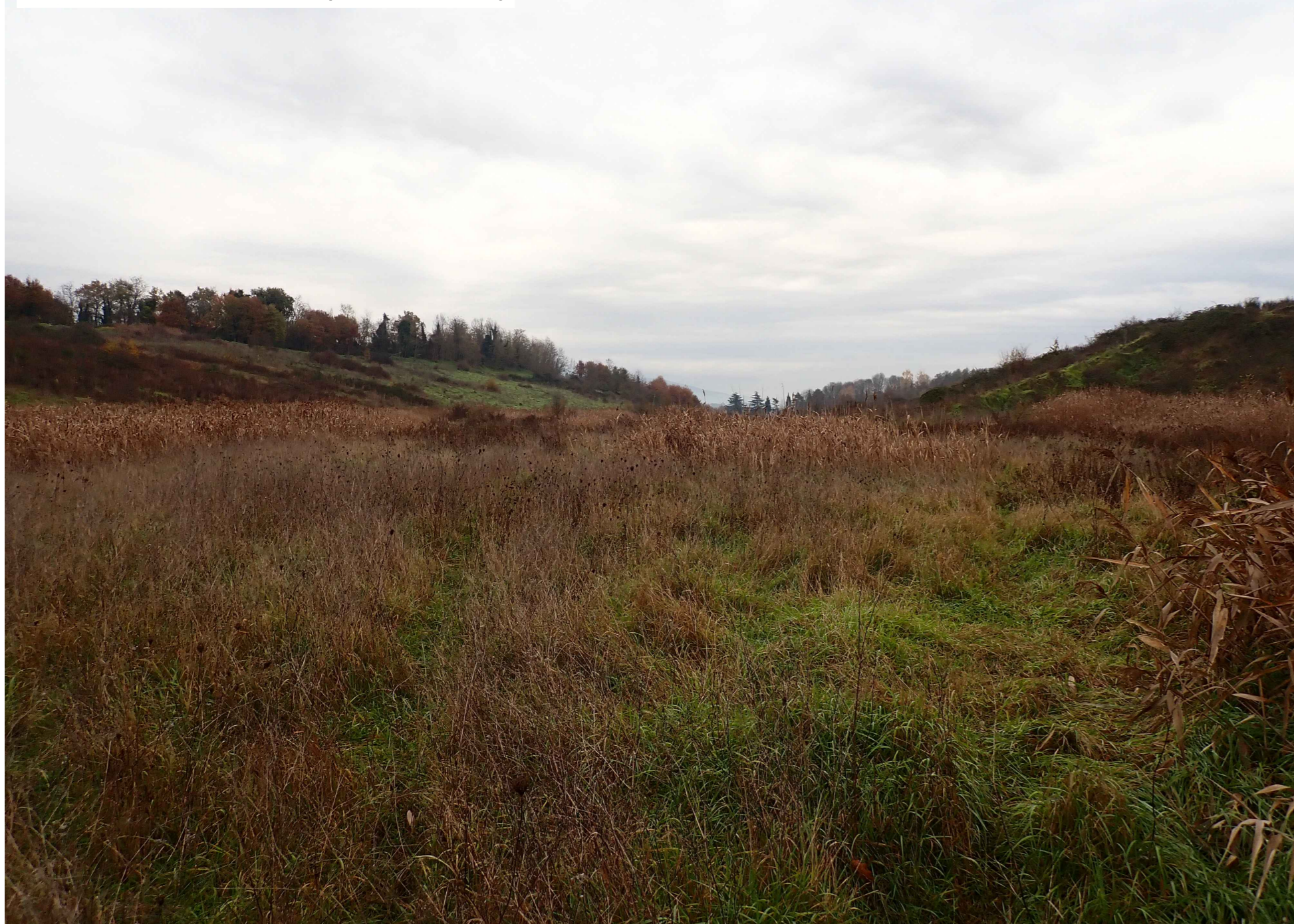
Situazione allo stato di fatto (novembre 2020)