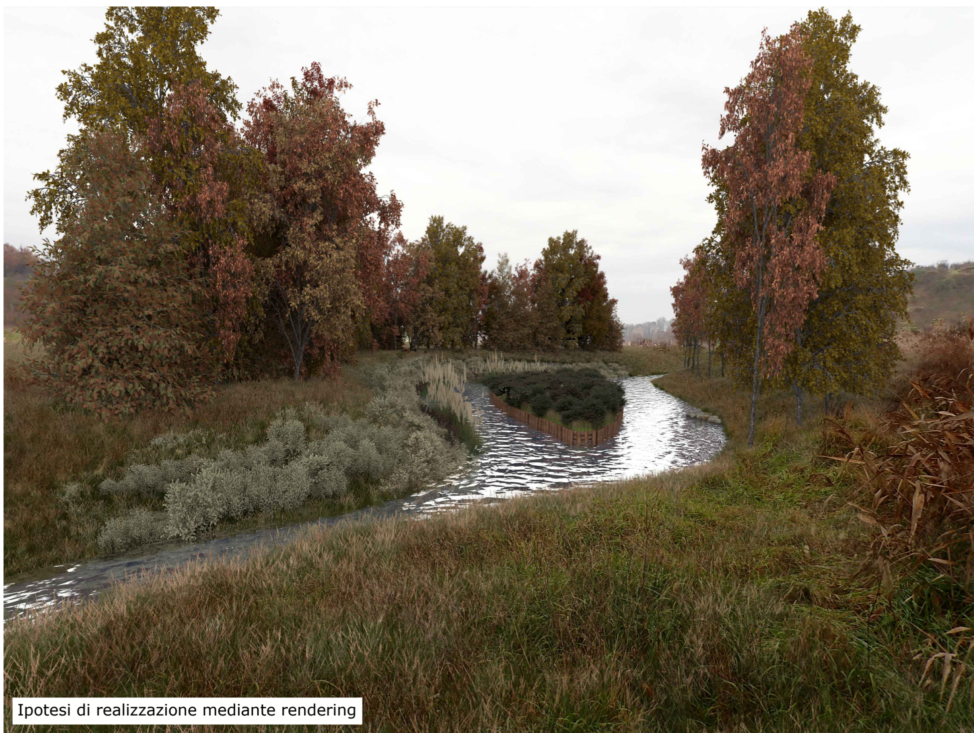
Ipotesi di realizzazione mediante rendering