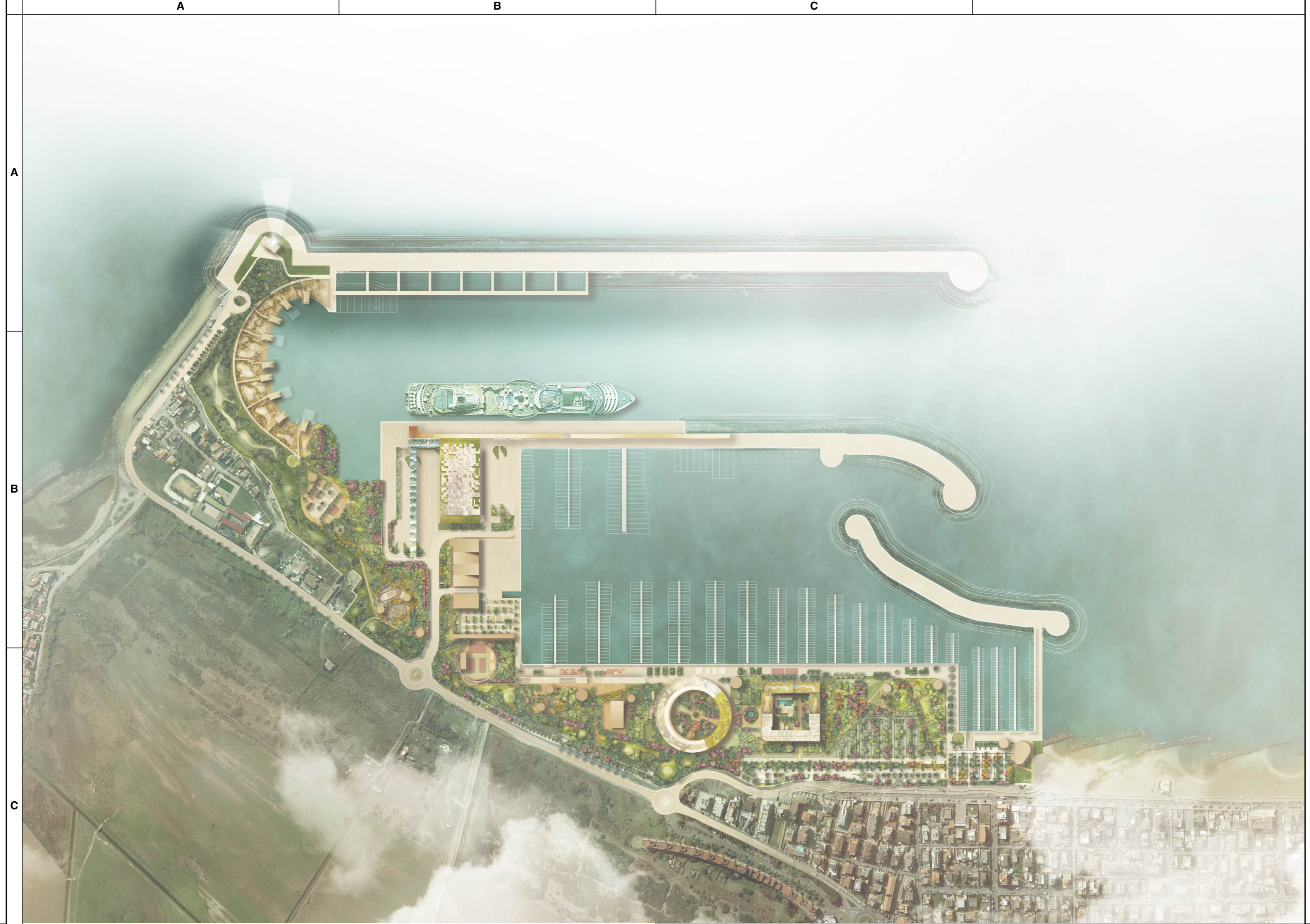
Planimetria generale _scala 1:5000