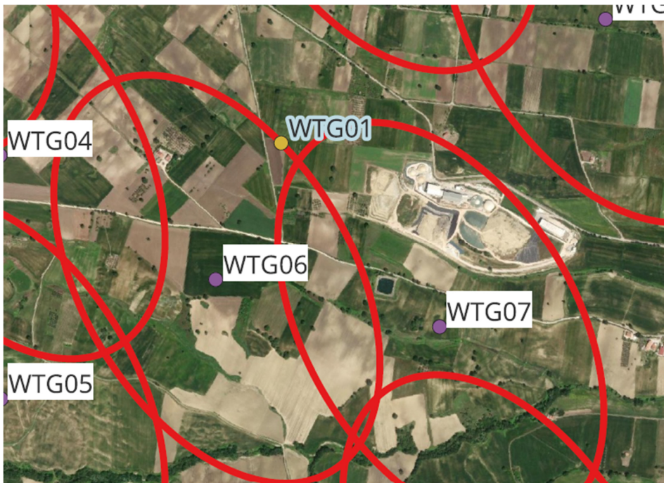
Figura 1 - particolare dell'interferenza tra gli aerogeneratori WTG06 della WE GUGLIONESI, e la WTG01 della LE.RO.DA.