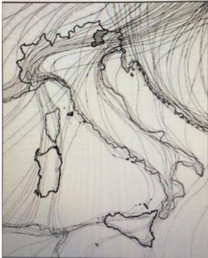
Fig. 1 – rappresentazione grafica delle principali direttrici migratorie Italiane. (Tratta da: "La migrazione dei rapaci diurni nel paleartico occidentale" - gruppo Migrans).

La Puglia ha un ruolo fondamentale nella migrazione di molte specie di uccelli svernanti nel Bacino del Mediterraneo (migratori a corto raggio) o nel Sud-Africa (migratori a lungo raggio). In relazione all'orografia del territorio salentino, alla frammentazione degli habitat naturali e all'antropizzazione i migratori si comportano diversamente. Nel Salento sulla base di studi sino ad ora condotti pare che i migratori si spostino su un ampio fronte, convergendo verso siti con funzione trofica, riproduttiva o di roost. In autunno i migratori provengono dai Balcani e dal nord Italia. Alcuni restano a svernare in Puglia mentre altri proseguono in Africa. In primavera i migratori in risalita dall'Africa transitano per la Sicilia e la Calabria o provengono direttamente. In pochi si fermano per nidificare, mentre la maggior parte prosegue alla volta dei Balcani (fig. 1). Ciò è quanto emerge dall'analisi dei dati di "cattura e ricattura" di soggetti inanellati (fig. 2).