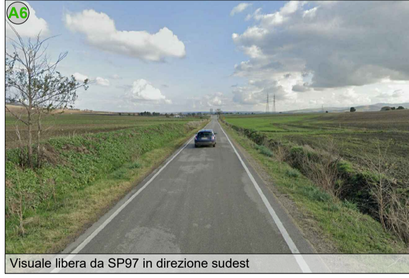
Visuale libera da SP97 in direzione sudest