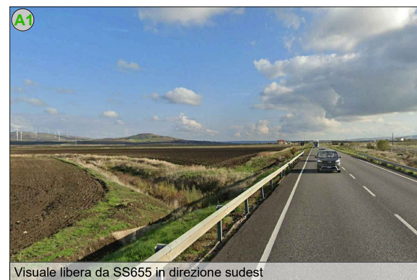
Visuale libera da SS655 in direzione sudest