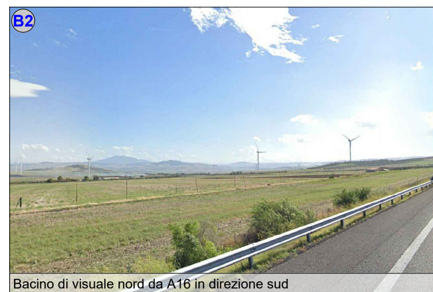
Bacino di visuale nord da A16 in direzione sud