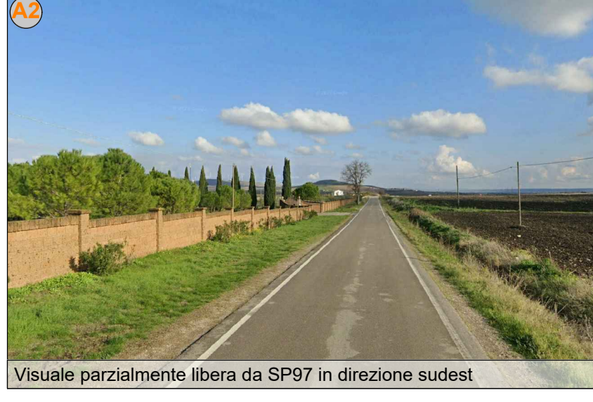
Visuale parzialmente libera da SP97 in direzione sudest