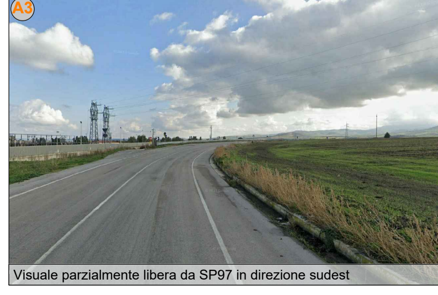
Visuale parzialmente libera da SP97 in direzione sudest