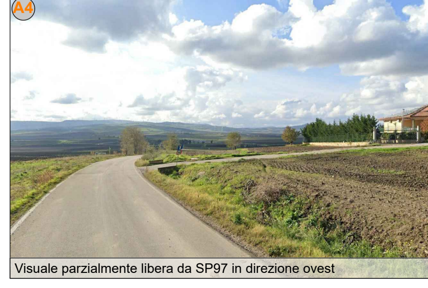
Visuale parzialmente libera da SP97 in direzione ovest