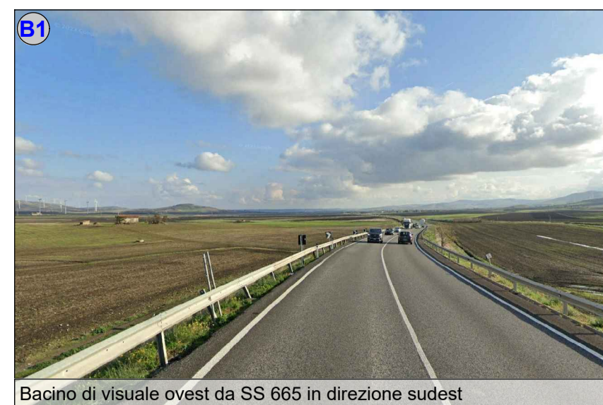
Bacino di visuale ovest da SS 665 in direzione sudest