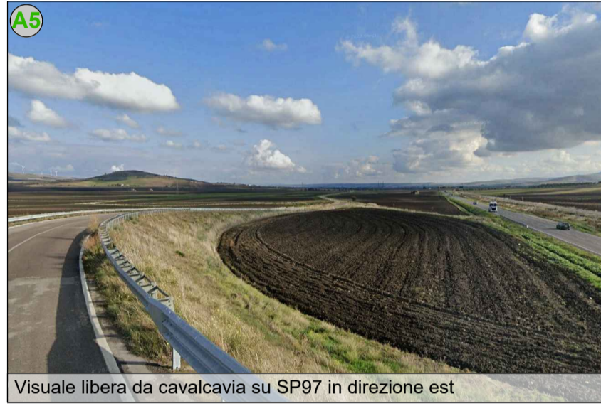
Visuale libera da cavalcavia su SP97 in direzione est