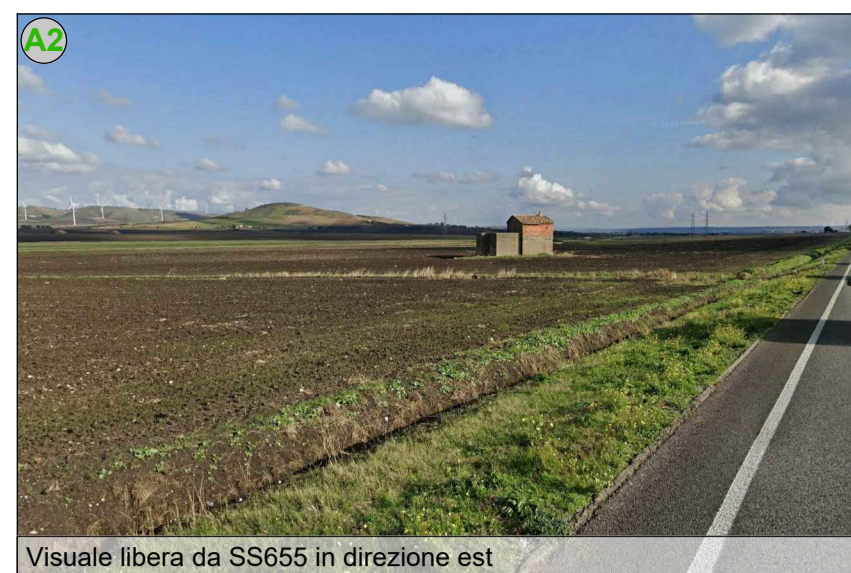
Visuale libera da SS655 in direzione est