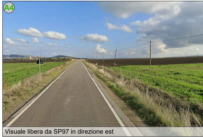
Visuale libera da SP97 in direzione est