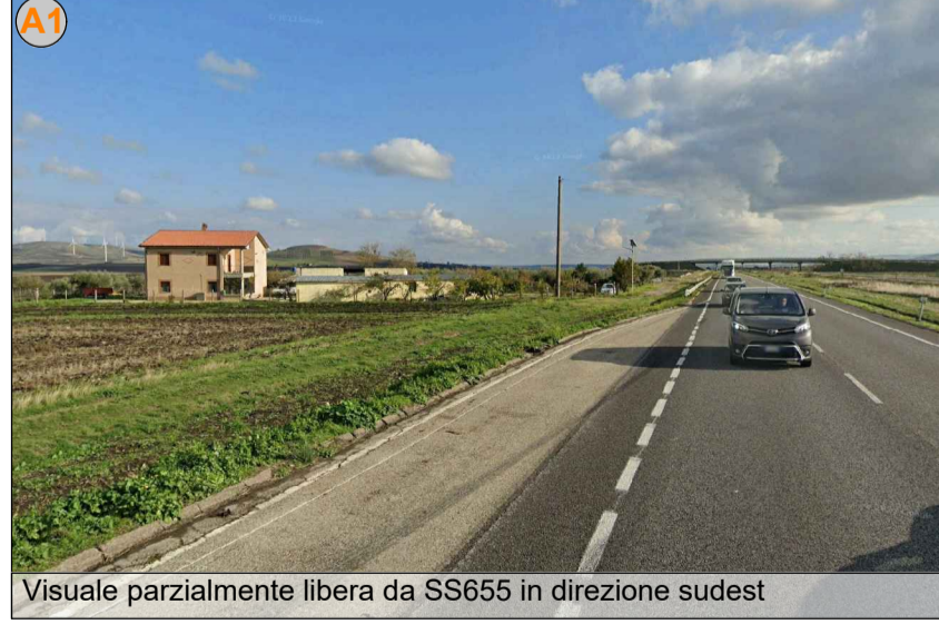
Visuale parzialmente libera da SS655 in direzione sudest