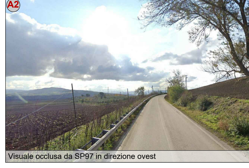
Visuale occlusa da SP97 in direzione ovest