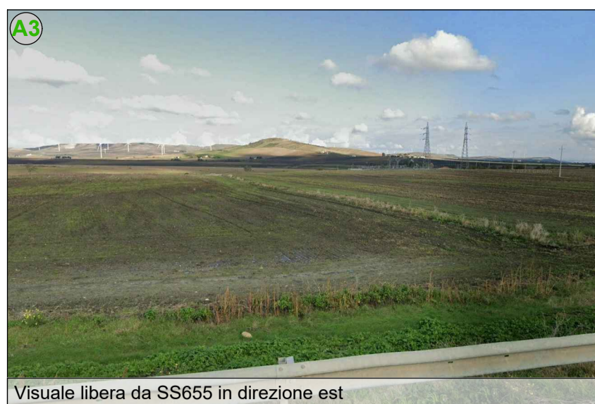
Visuale libera da SS655 in direzione est