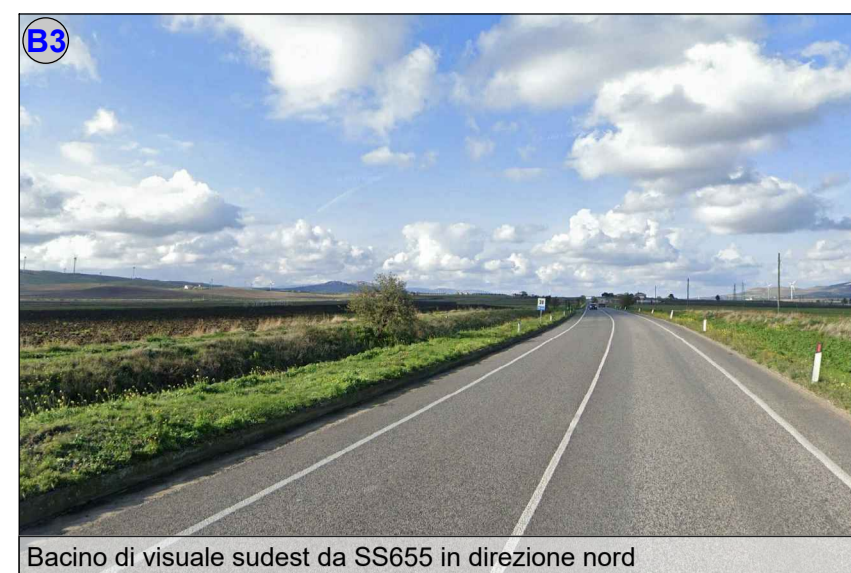
Bacino di visuale sudest da SS655 in direzione nord