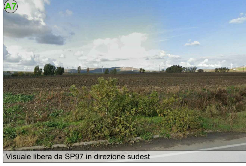
Visuale libera da SP97 in direzione sudest