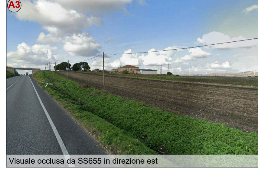
Visuale occlusa da SS655 in direzione est