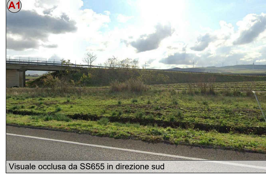
Visuale occlusa da SS655 in direzione sud