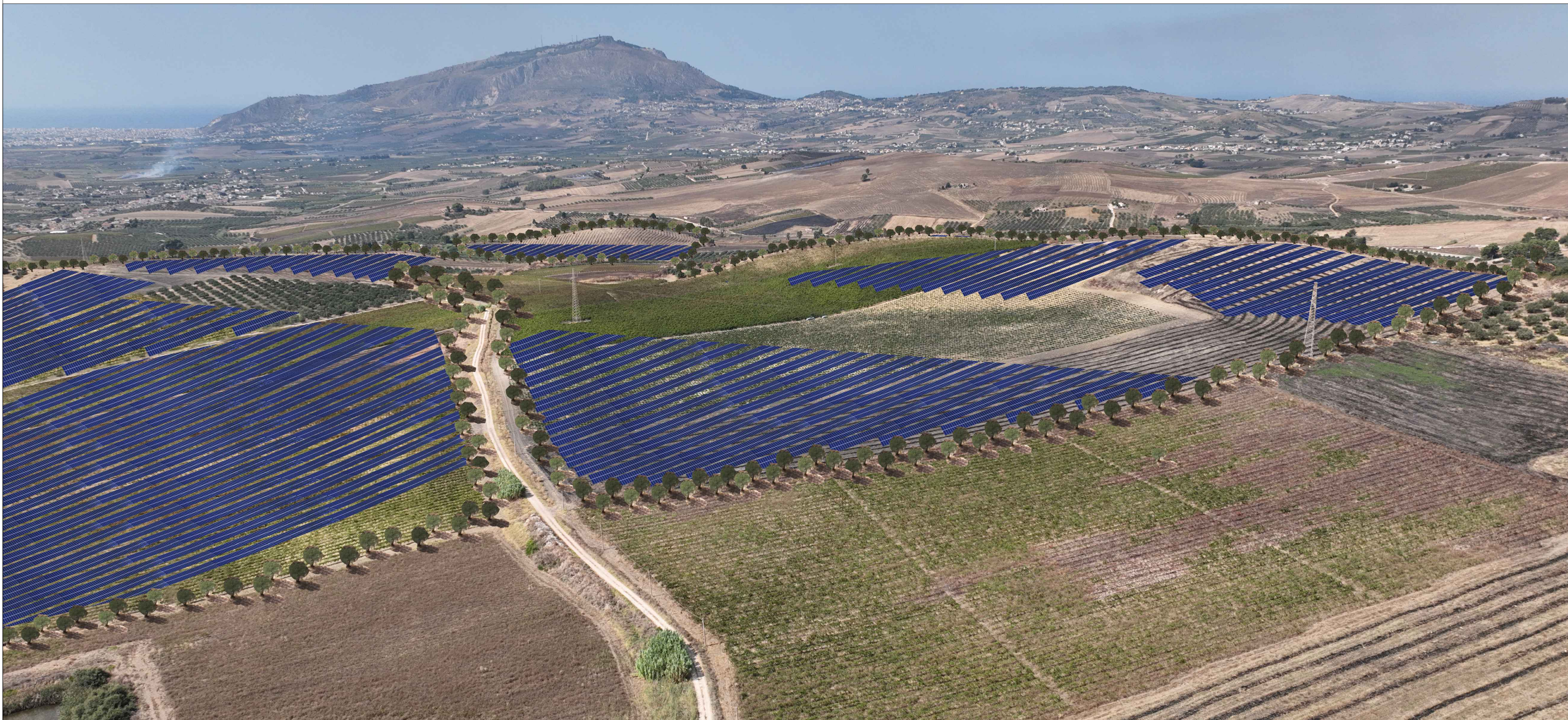
Fotoinserimento POST OPERAM