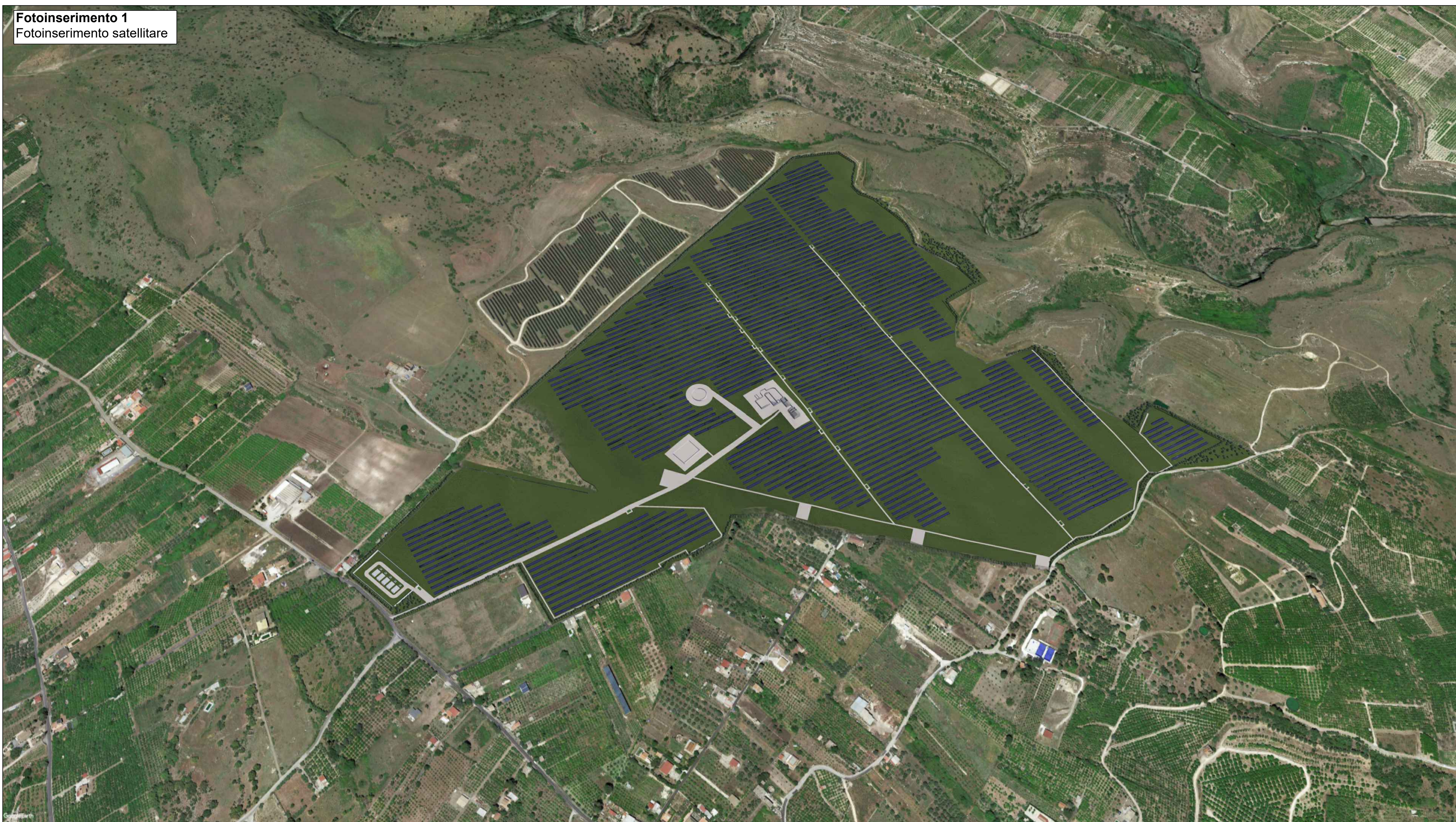
Fotoinserimento 1 Fotoinserimento satellitare