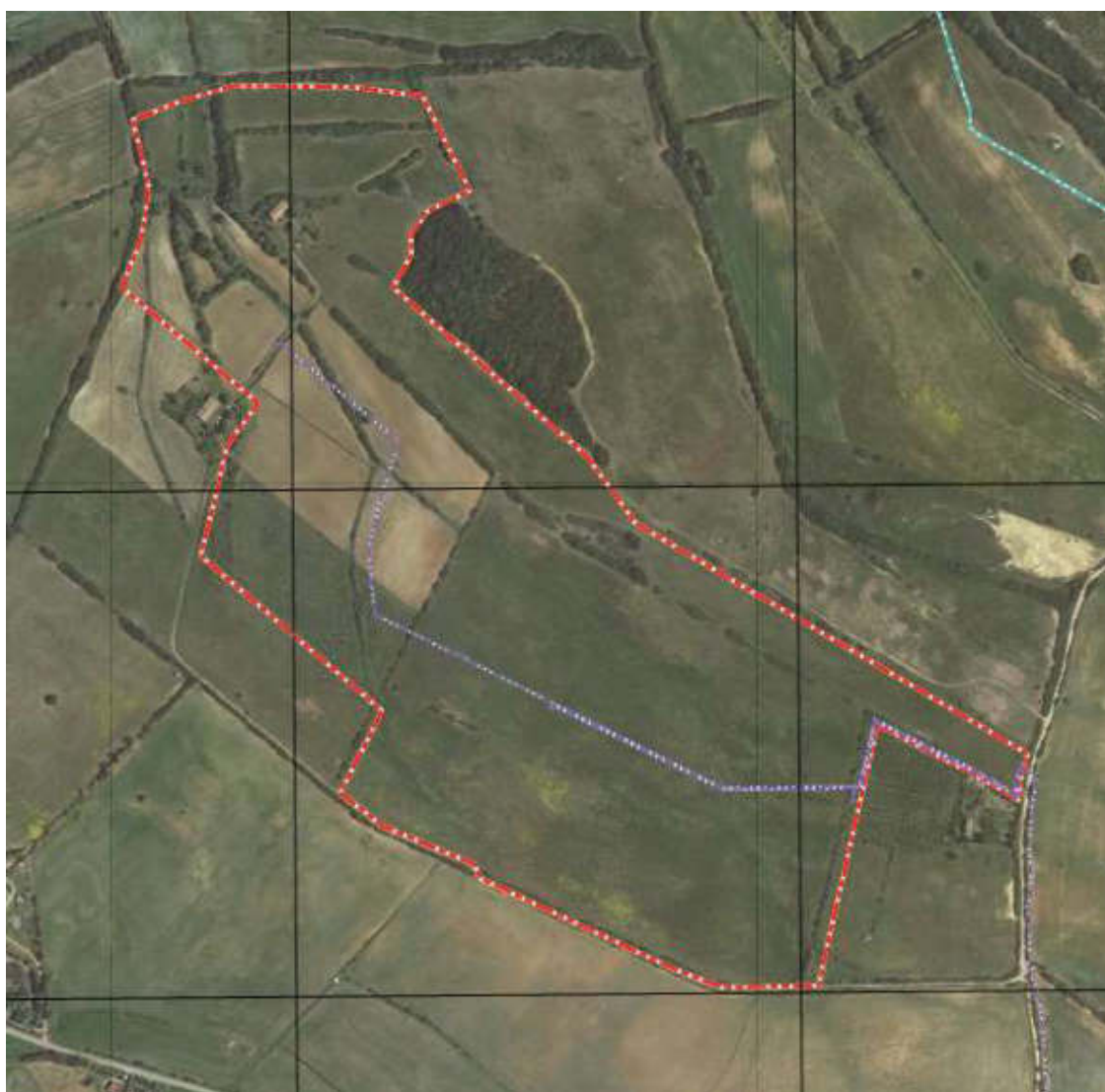
Figura 1: Inquadramento dell'area d'interesse su ortofoto. Lotto 1

Il presente documento costituisce parte integrante del progetto definitivo di un impianto agro-voltaico per la produzione di energia elettrica da fonte fotovoltaica, da realizzarsi con moduli fotovoltaici in silicio monocristallino installati su inseguitori solari monoassiali. L'impianto, insistente su una superficie di circa 70 ettari, è situato in un'area localizzata nel distretto della Nurra, all'interno del comune di Sassari, nella provincia omonima.