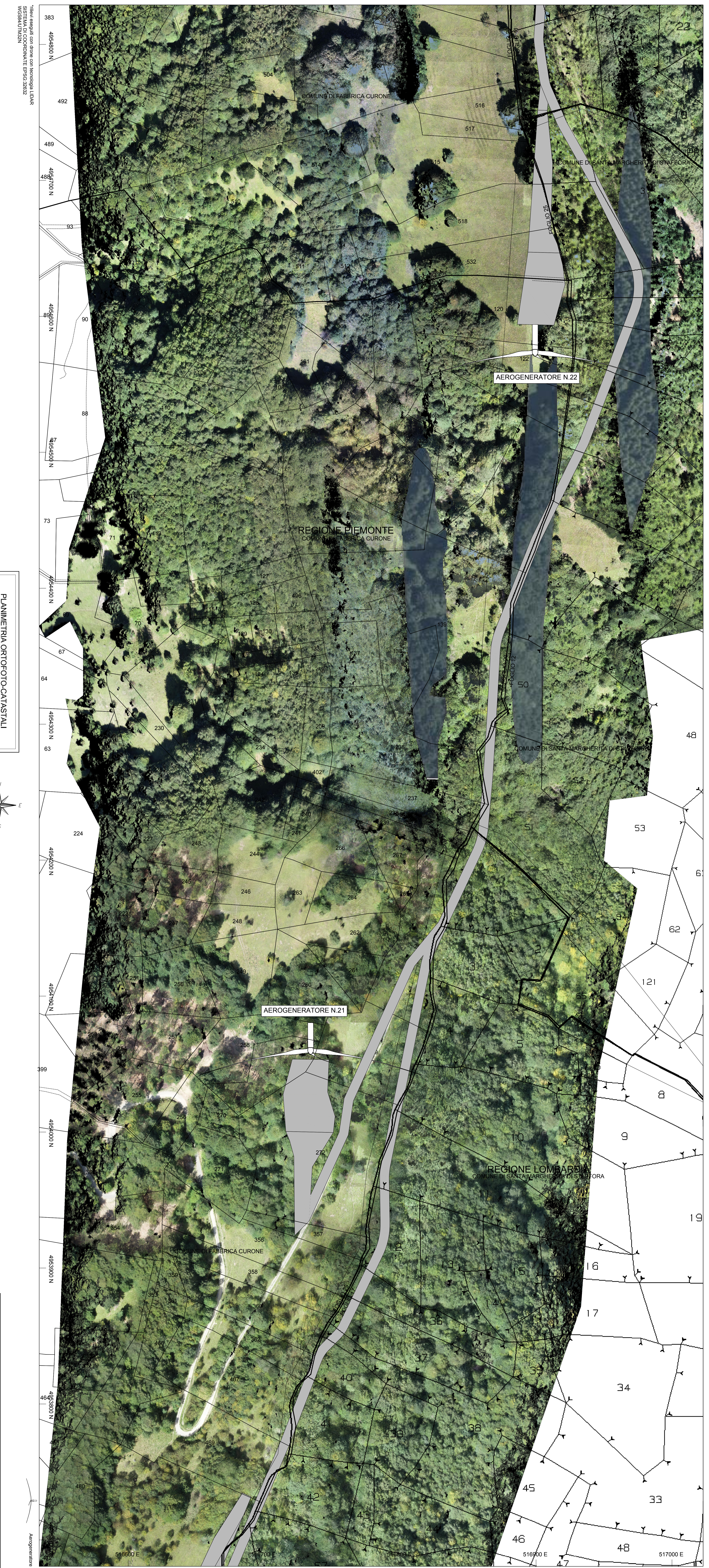
PLANIMETRIA ORTOFOTO-CATASTALI scala 1:1000