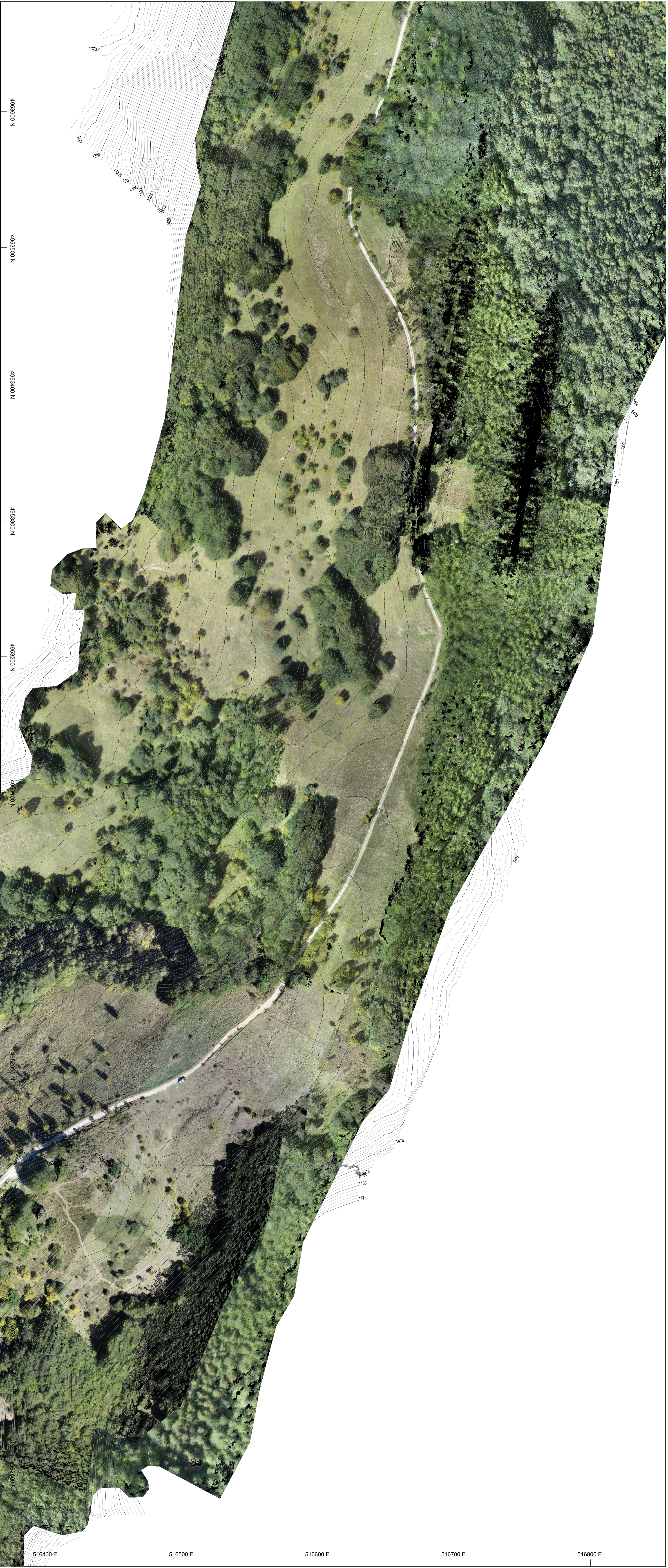
PLANIMETRIA ORTOFOTO-CURVE DI LIVELLO scala 1:1000