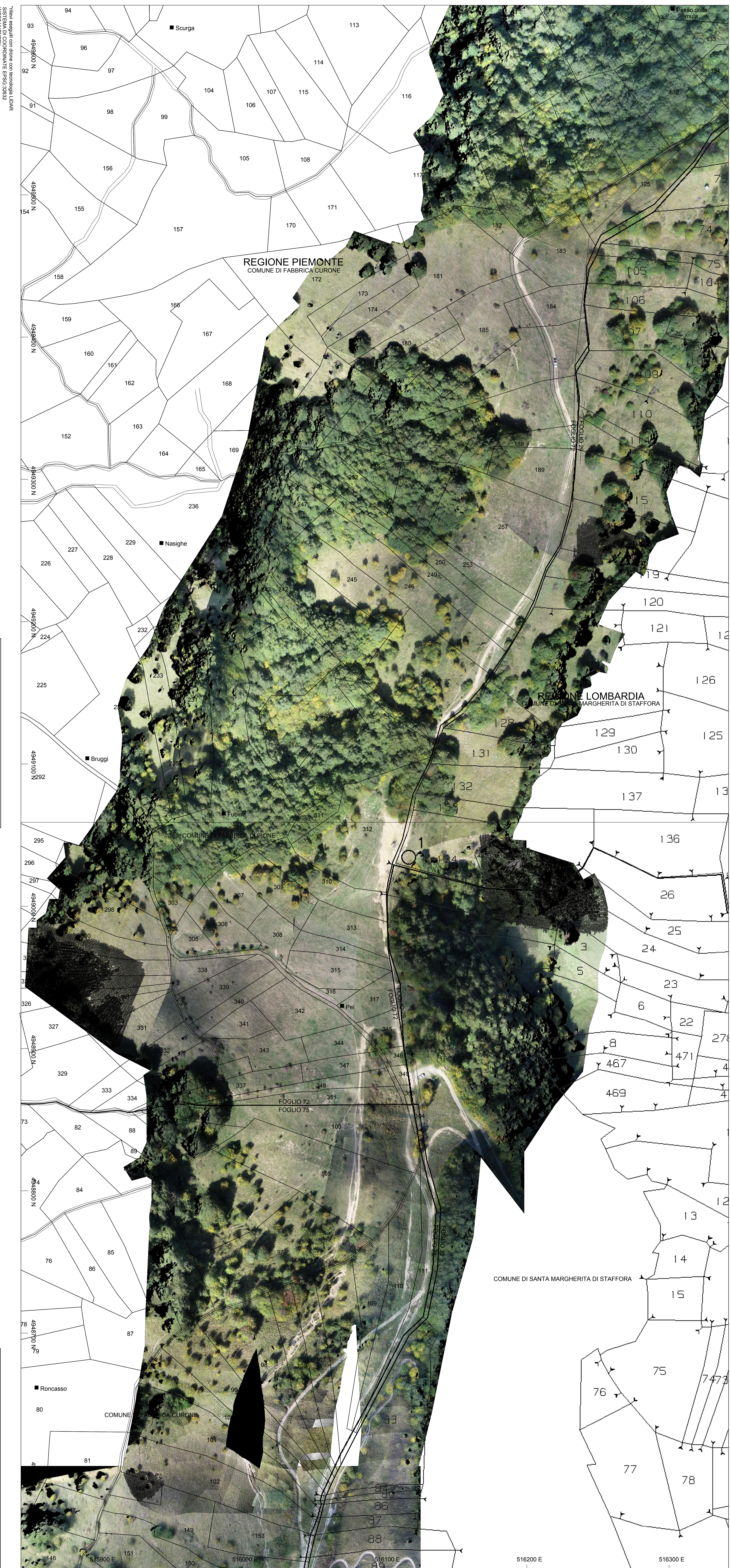
PLANIMETRIA ORTOFOTO-CATASTALE Scala 1:1000