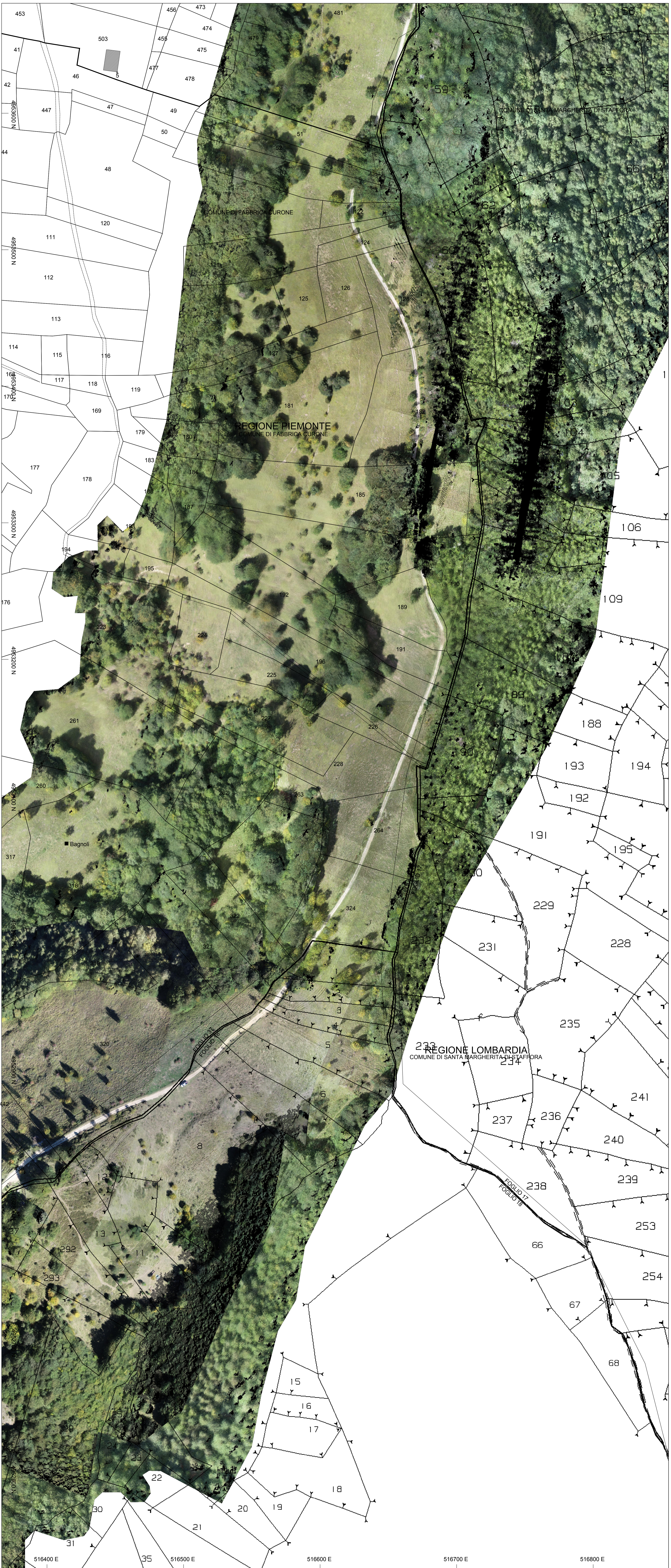
PLANNIETRIA ORTOFOTOCATASTALI Scala 1:1000