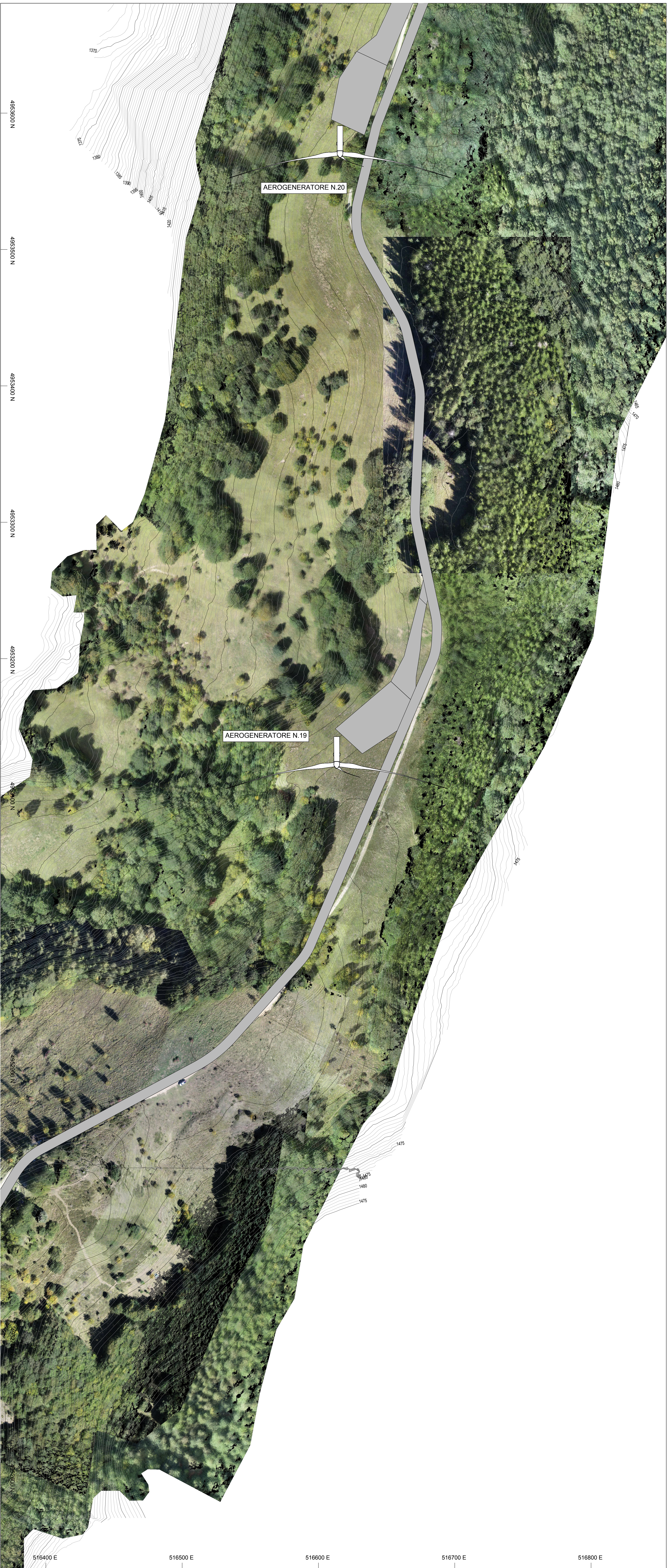
PLANIMETRIA ORTOFOTO-CURVE DI LIVELLO scala 1:1000