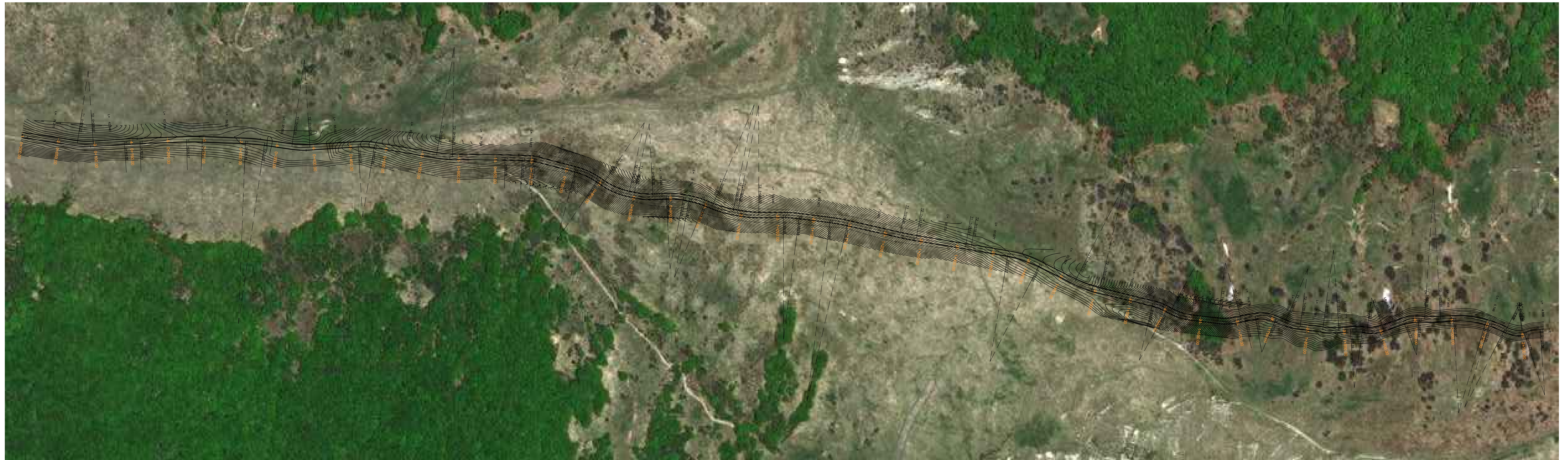
*rilevi eseguiti con drone con tecnologia LiDAR *sottoposto derivato da Bing Maps