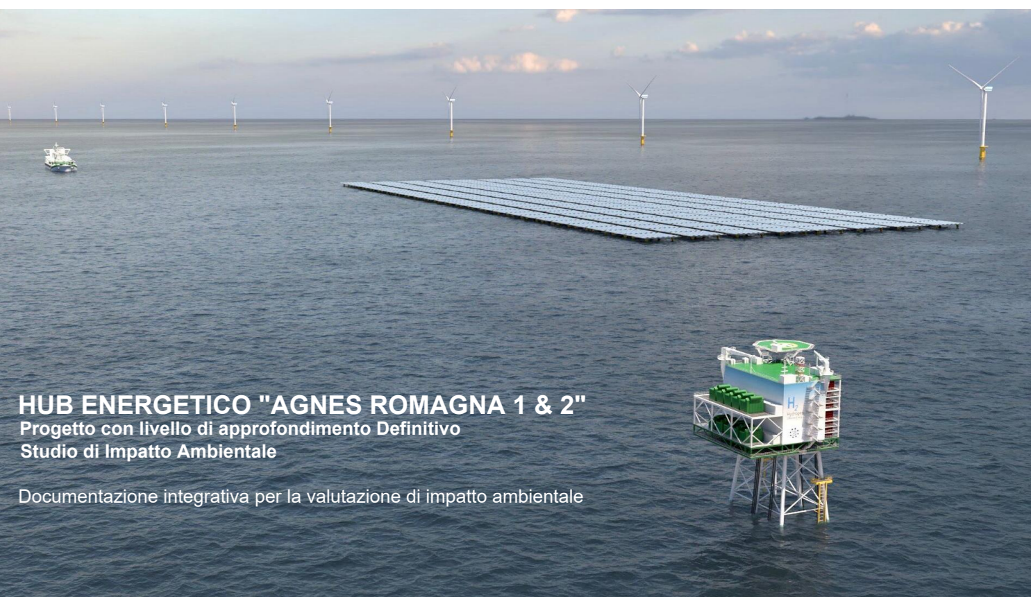
HUB ENERGETICO "AGNES ROMAGNA 1 & 2" Progetto con livello di approfondimento Definitivo Studio di Impatto Ambientale Documentazione integrativa per la valutazione di impatto ambientale

Autore elaborato: AGNES Codice identificativo elaborato: AGNROM_EP_D_PLA-ARP-TECH_REV01 Titolo elaborato: PLANIMETRIA TECNICA AREA AGNES RAVENNA PORTO