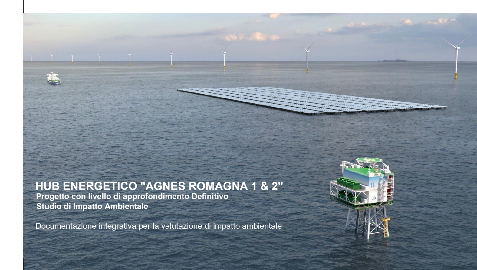
HUB ENERGETICO "AGNES ROMAGNA 1 & 2" Progetto con livello di approfondimento Definitivo Studio di Impatto Ambientale Documentazione integrativa per la valutazione di impatto ambientale

Autore elaborato: AGNES Codice identificativo elaborato: AGNROM_INT-D_PLA-SER Titolo elaborato: PLANIMETRIA AREA AGNES RAVENNA PORTO: LOCALIZZAZIONE RISERVE IDRICHE ANTINCENDIO