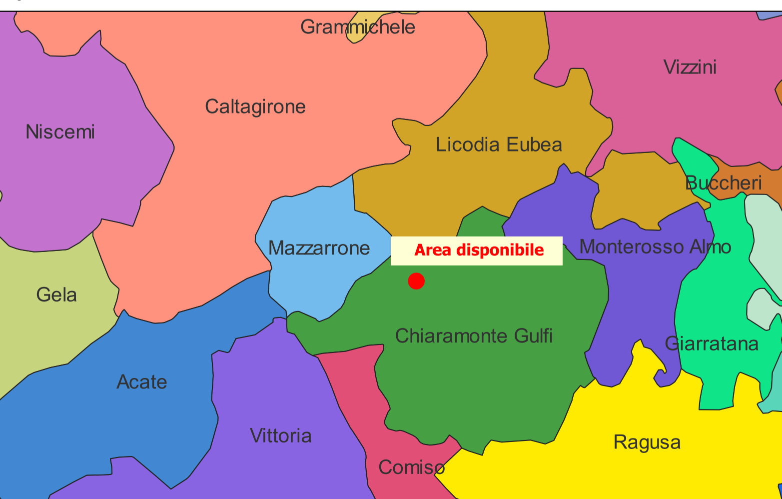
INQUADRAMENTO TERRITORIALE - SCALA 1:200.000