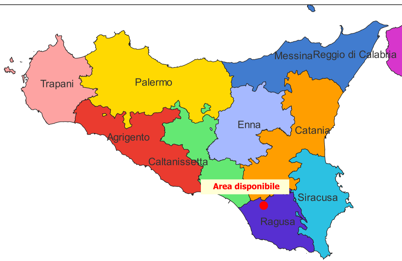
INQUADRAMENTO TERRITORIALE - SCALA 1:1.500.000

FIRMA RESPONSABILE FIRMA DIGITALE PROGETTISTA FIRMA GEOGRAFICA E TIMBRO PROGETTISTA