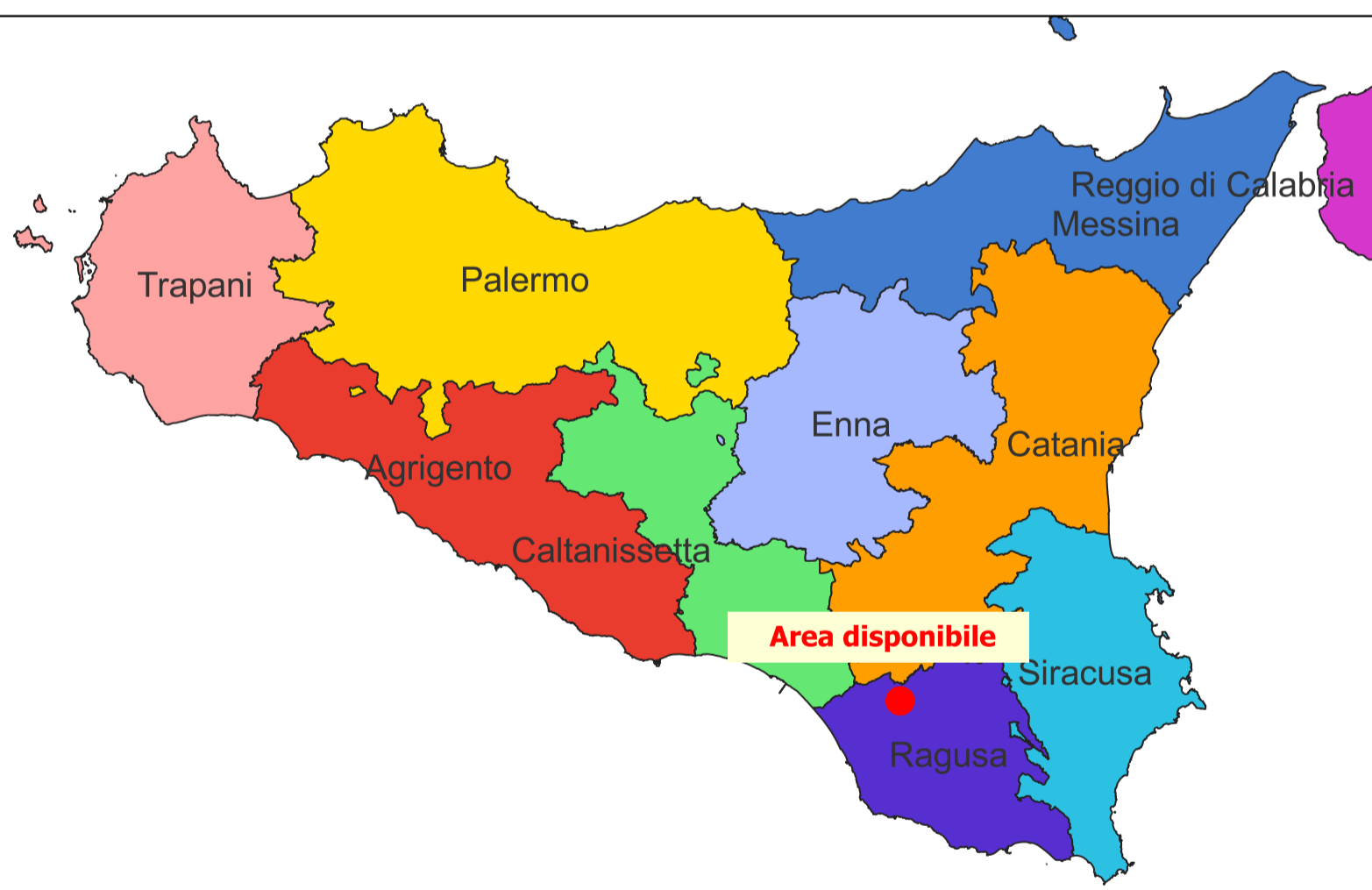
INQUADRAMENTO TERRITORIALE - SCALA 1:1.500.000