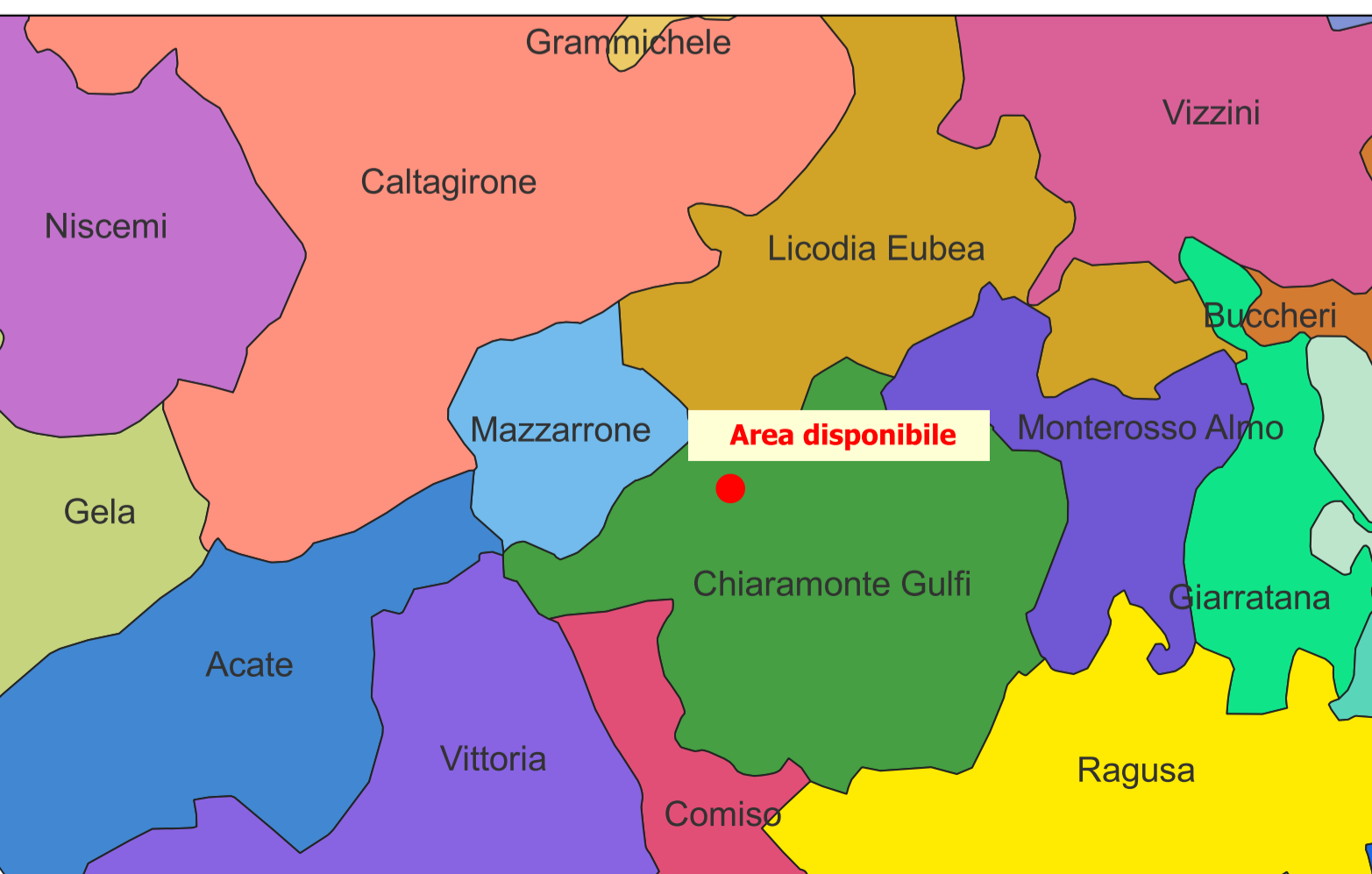
INQUADRAMENTO TERRITORIALE - SCALA 1:200.000