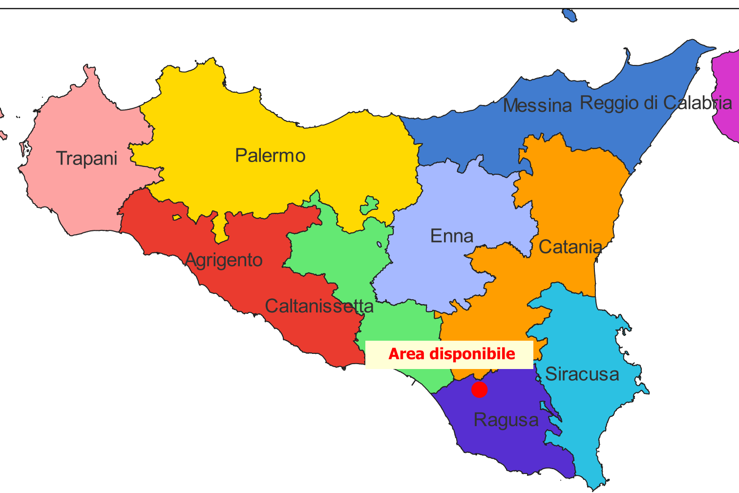
INQUADRAMENTO TERRITORIALE - SCALA 1:1.500.000