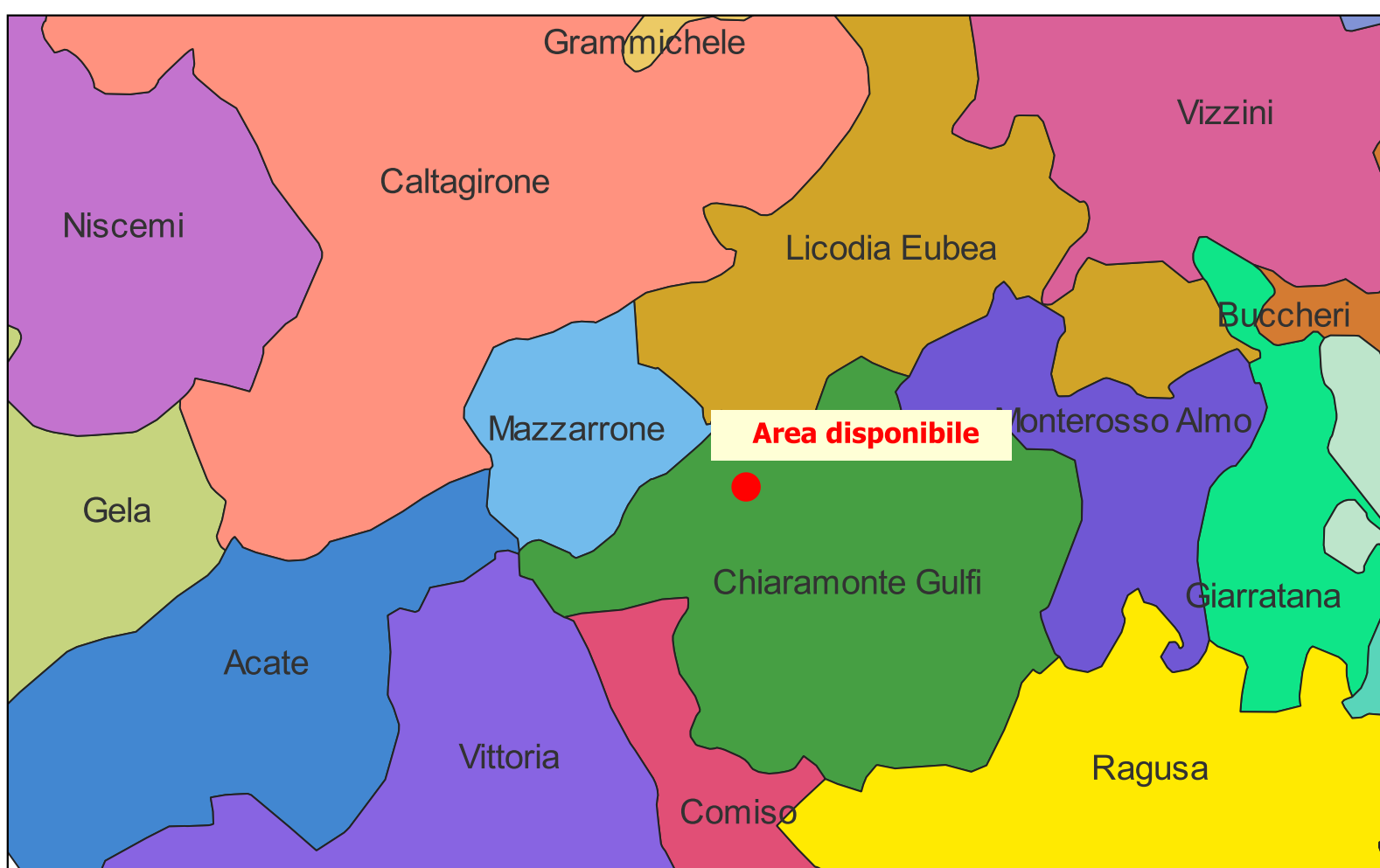
INQUADRAMENTO TERRITORIALE - SCALA 1:200.000