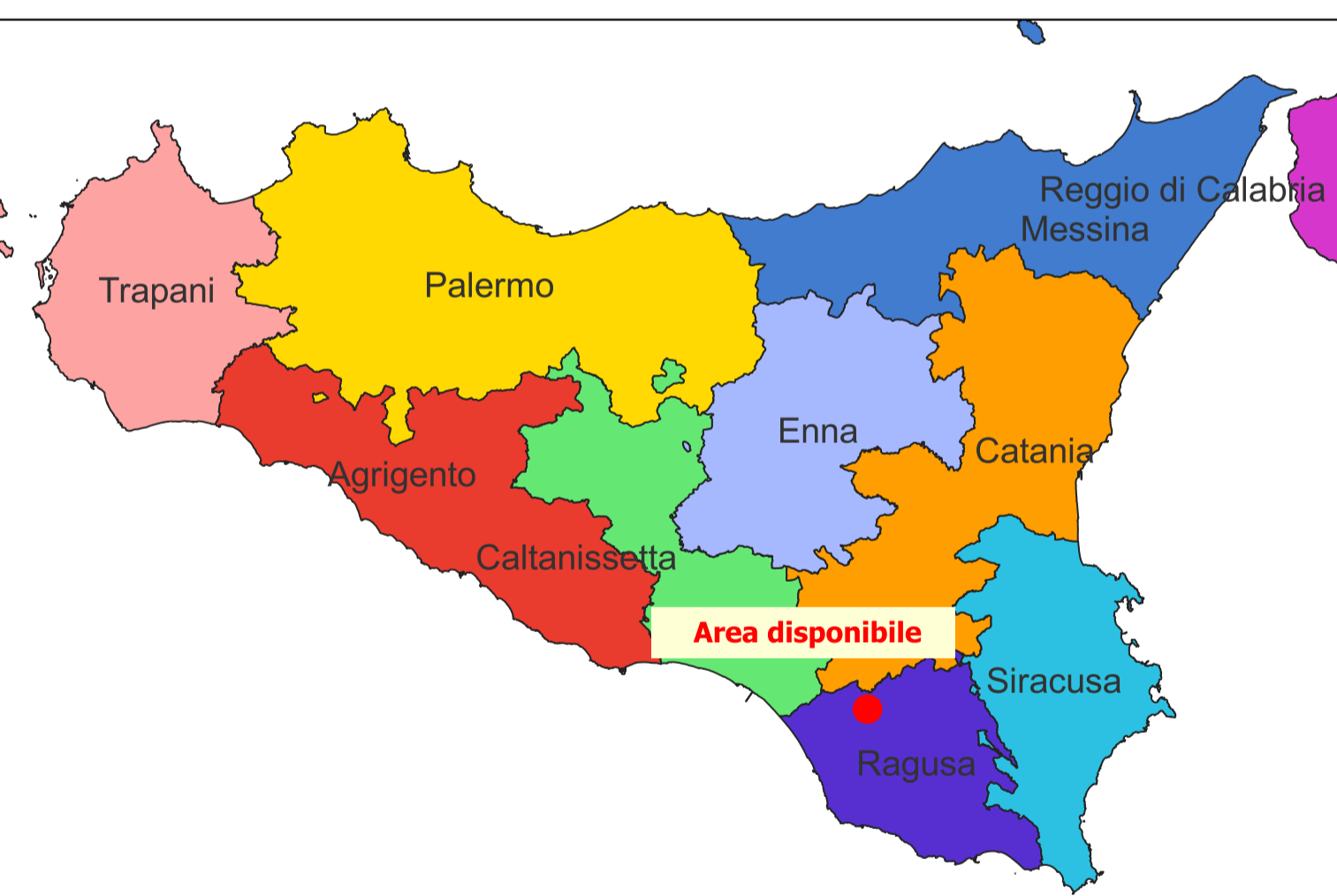
INQUADRAMENTO TERRITORIALE - SCALA 1:1.500.000