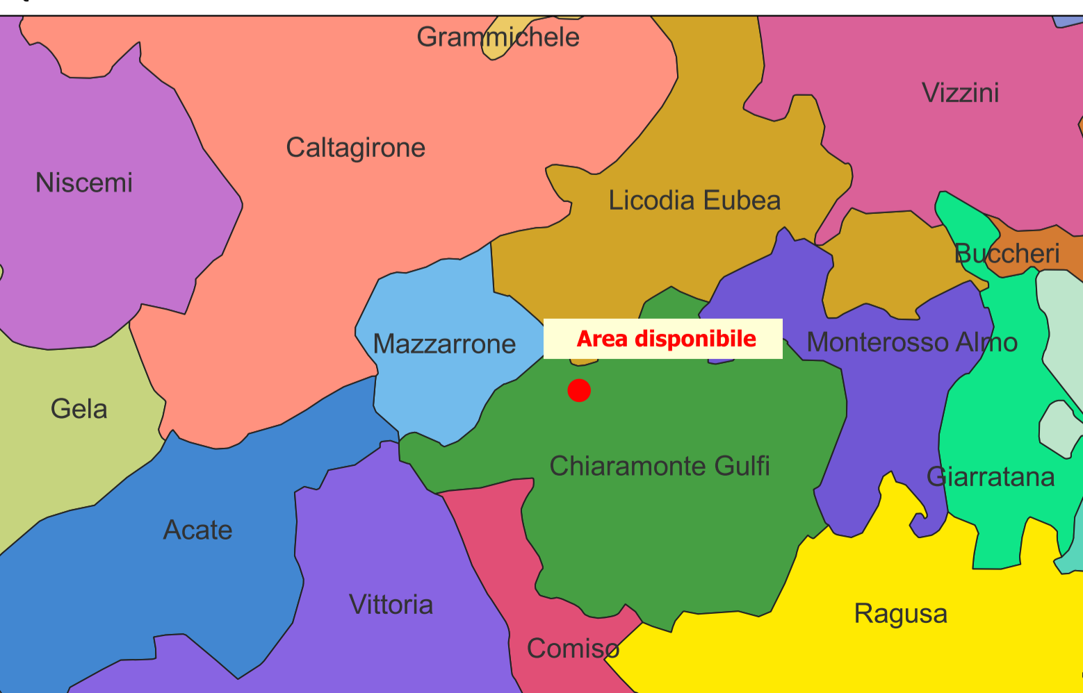
INQUADRAMENTO TERRITORIALE - SCALA 1:200.000