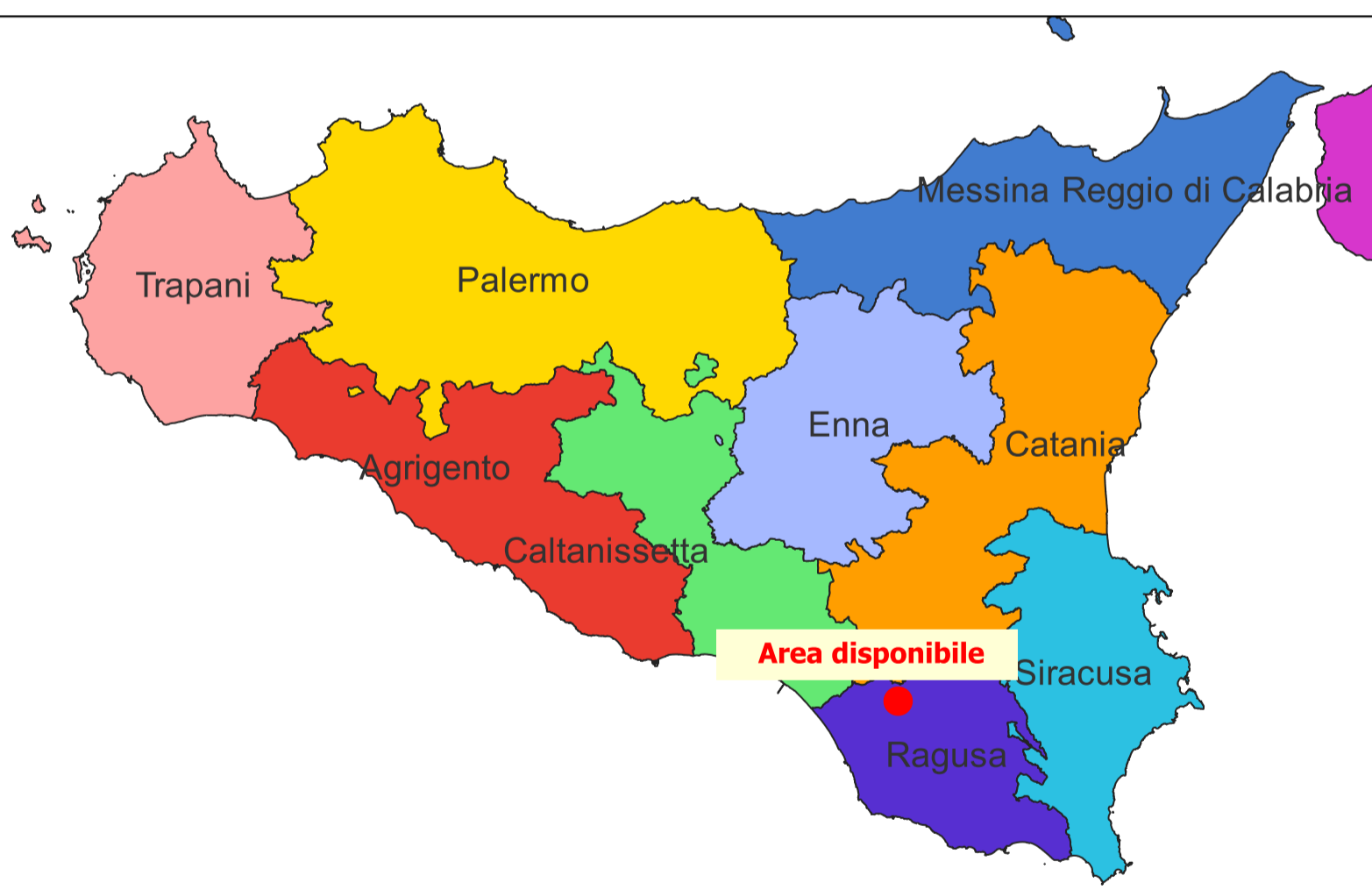
INQUADRAMENTO TERRITORIALE - SCALA 1:1.500.000