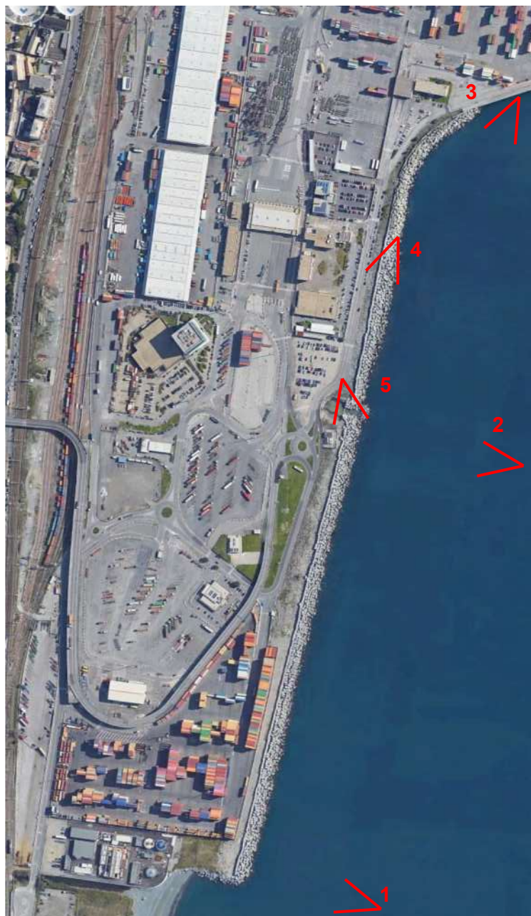
Punti di presa

Di seguito si riportano l’ubicazione dei punti di presa e le fotografie dello stato dei luoghi per i vari interventi previsti.