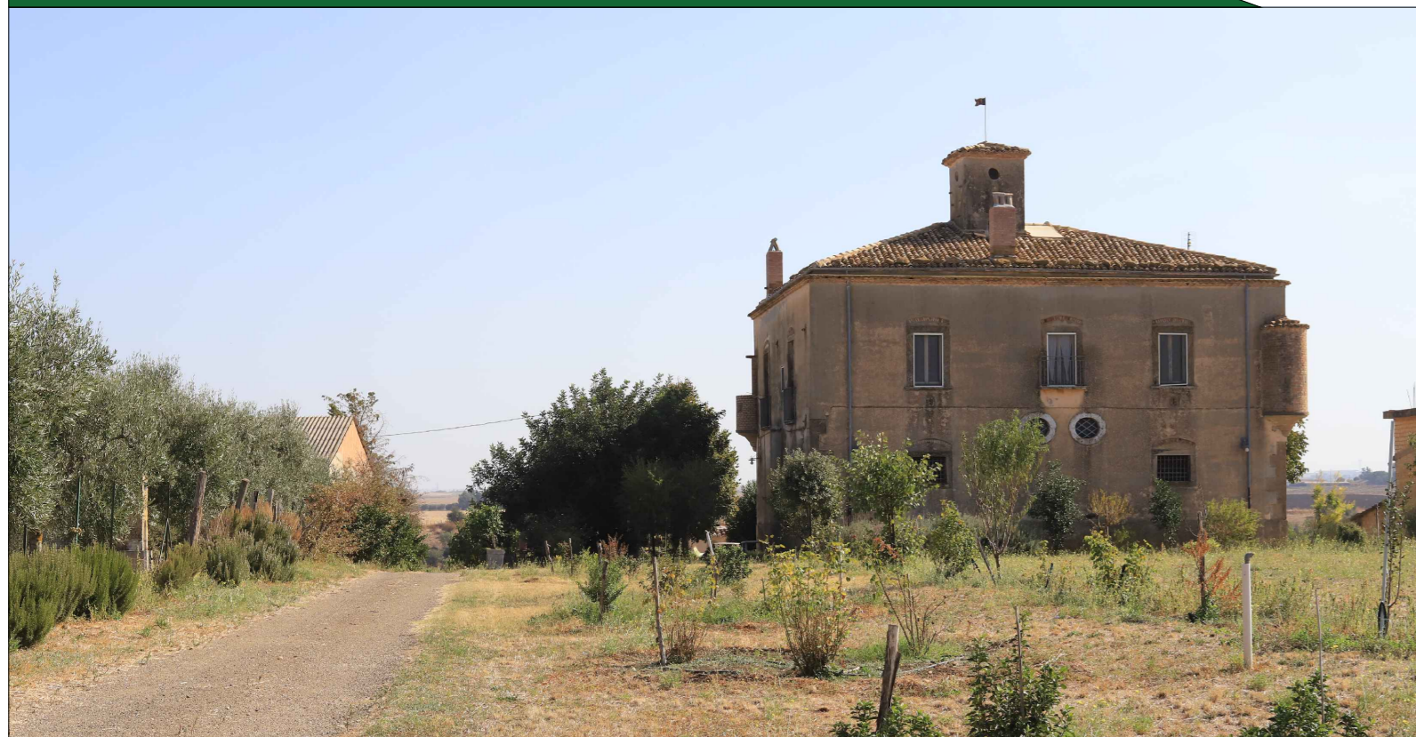
Foto Bene 6_Masseria Bosco delle Rose